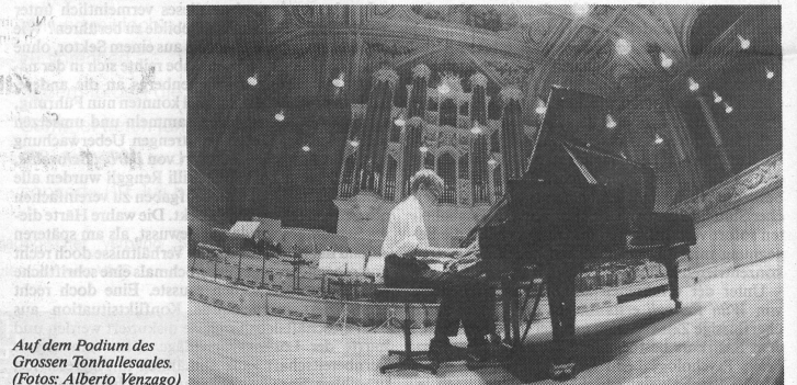
Auf dem Podium des Grossen Tonhallsaales.

drei namhafte Personen, die mit sorgfältig und liebevoll gestalteten Wunschzetteln, ähnlich wie sie bei Hochzeiten verwendet werden, persönlich bei Industrie und Gewerbe für die Anliegen der Musikschule warben. Grosse Bedeutung misst die Leitung der JMF den vielen und verschiedensten Aktivitäten seitens der Musikschule bei. So war die Jahresversammlung begleitet von einem Benefizkonzert der Lehrerschaft. Vom gutbesuchten Informationsnachmittag floss der Erlös aus dem Verkauf von Kuchen und Kaffee in den Instrumentenfonds. Neben der bereits bestehenden Compact Disc des Klarinettenquintetts der JMF wurde von der Lehrerschaft eine Musikkassette eingespielt, die einen musikalischen Querschnitt durch das ganze Angebot der JMF bietet. Als Werbeträger wurden «Geschicklichkeits-Würfel» mit dem Signet der JMF versehen und bestens verkauft. Während der Aktivitätenwoche wurden täglich zur selben Zeit in der Altstadt von Frauenfeld Schülerkonzerte dargeboten.