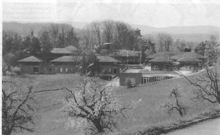
Die evangelische Heimstätte Leuenberg ob Hölstein im Waldenburgerthal (BL) erhielt einen zusätzlichen Anbau (vorne rechts). Der Ort bietet ideale Voraussetzungen zur Durchführung der VMS-Schulleiterkurse.

Die Leitung einer Musikschule ist – bei allen fachlichen und organisatorischen Fähigkeiten, die dafür vorausgesetzt werden – eine Führungsaufgabe mit speziellen Anforderungen. So ist es richtig, dass zwei volle Arbeitstage dieses Basiskurses dem Zürcher Institut für Angewandte Psychologie IAP übertragen wurden. Unter dem Thema «Führung und Arbeitstechnik» waren die Teilnehmer aufgefordert, sich mit führungspsychologischen Grundsätzen auseinanderzusetzen und sich der Herausforderung zu stellen, Führung als Rolle zu übernehmen, in der Persönlichkeit und ständig