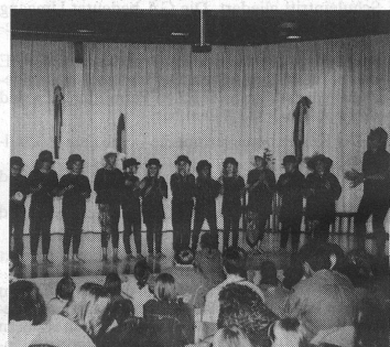
Auch die Musikalische Grundschule trug - hier mit einem lustigen Tanz - zum bunten Angebot der Festdarbietungen bei.

te am Samstagnachmittag in Moosseedorf ein reichhaltiges Festprogramm beginnen. Im Kirchgemeindehaus, in der Kirche und im alten Schulhaus wurden von den Schülern musikalische Leckerbissen präsentiert, während auf dem Vorplatz die Risottoküche fürs leibliche Wohl sorgte. Für grosse und kleine Kinder gab es ein Musikquiz, eine Klangwerkstatt, Schminken, Glücksfischen und vieles mehr. Abgeschlossen wurde der fröhliche Nachmittag mit der Aufführung des musikalischen Märchens Pezzettino.