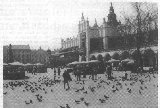
Marktplatz mit Tuchhallen – Krakau, nicht Venedig!