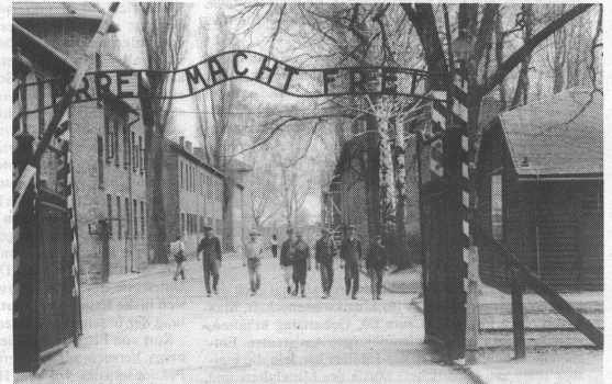
Eingang zum Konzentrationslager Auschwitz: «Arbeit macht frei».