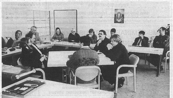
Rollenspiel: Fünf Prüflinge simulieren eine Sitzung, die anderen schauen zu und analysieren anschliessend ihre Beobachtungen.

Zwei der Rollenspiele nahmen dabei einen völlig gegensätzlichen Verlauf. Im ersten versuchte der «Schulpräsident» mit ruhiger, sachlicher Art sämtliche Emotionen auszuschnallen, dennoch kamen sie später in Form von persönlichen Angriffen der frustrierten Lehrvertreter hoch. Im zweiten Spiel hingegen beruhigten sich die Ak-