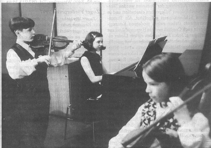
Vor dem grossen Auftritt: Einspielen im stillen Kämmerlein.