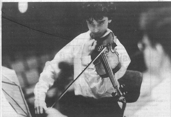
Auf dem Podium: Auf die gute Stimmung kommt es an.