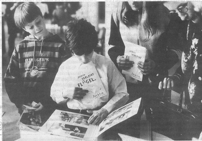
Was bleibt: Gute Erinnerungen an ein starkes Erlebnis und sprechende Bilder von Alberto Venzago.