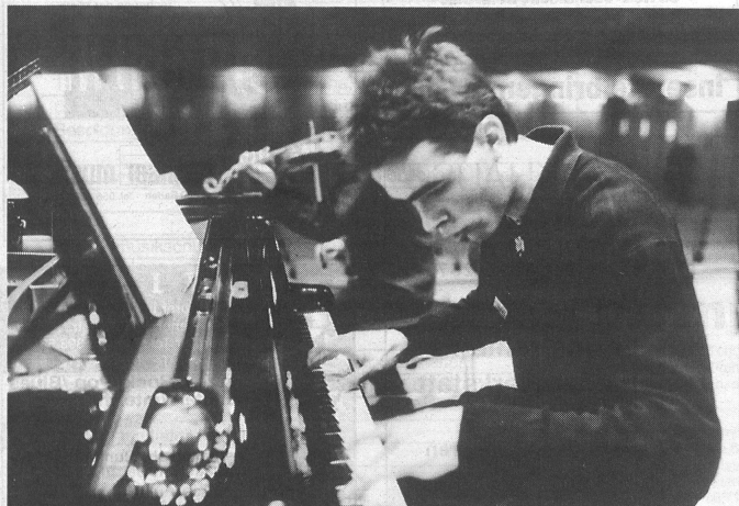
Der grosse Augenblick: Mit höchster Konzentration in die Tasten und Saiten gegriffen.