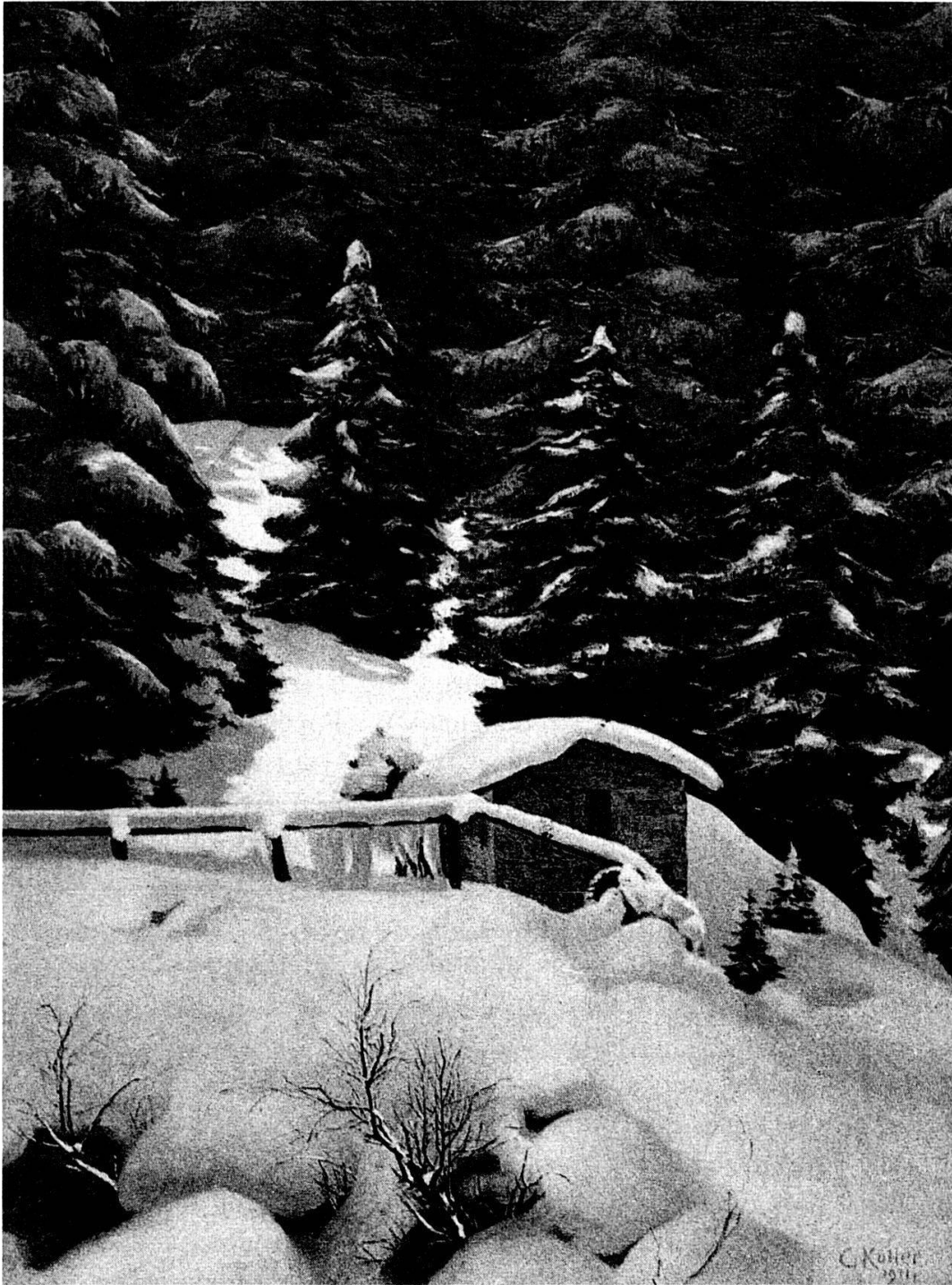
Mulin dall'Acla Mulin ella Val Sumvitg ils anno 1926. Baghetg da crap el sien d'unviern; liungas canals che tonschan vi tiel rein da Vallesa. Stampa Brunner, Turitg, tenor pictura da F. Waldejo. Carta da Toni Cathomas-Candinas, Sumvitg.