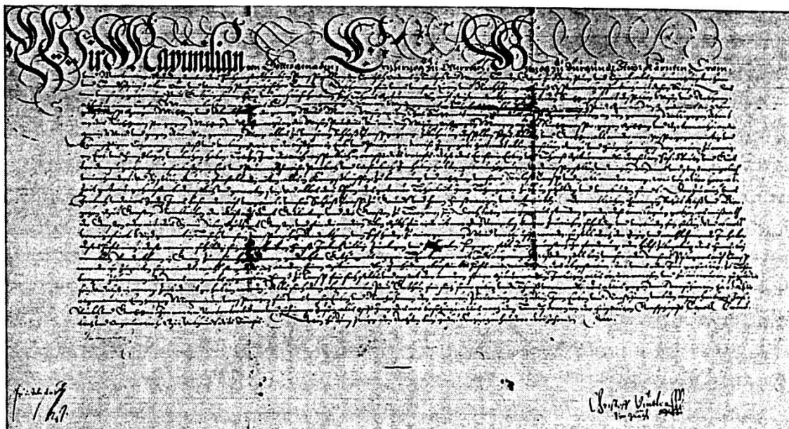
Charta da feud dal 1613 da l'archiducha Maximilian pel bain da Suort. Ils prüms plets sun legibels: «Wir Maximilian von Gottes Genaden Erzherzog von Österreich . . .»