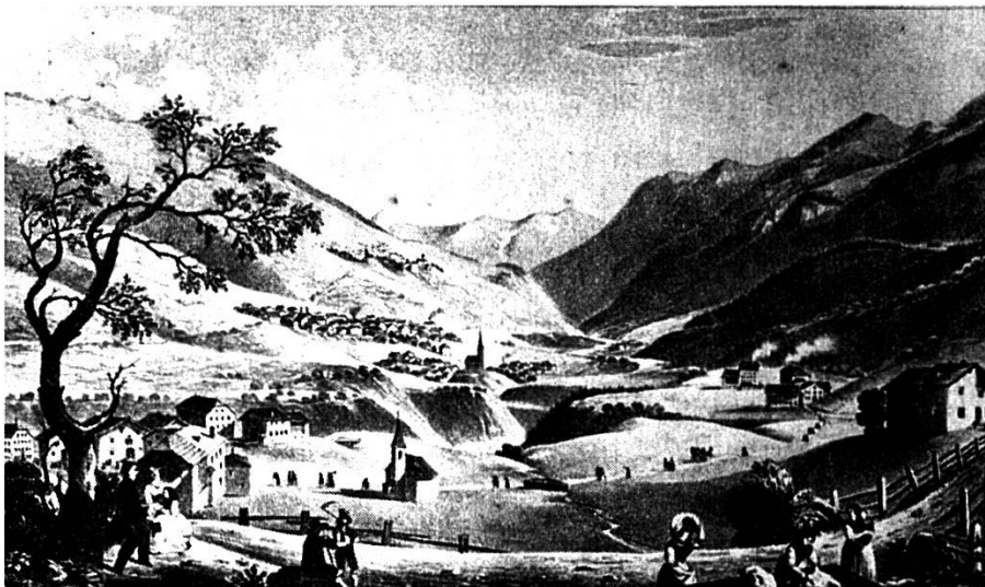
Gravüra da Vulpera Dadaint e Dadoura, intuorn il 1830

Las gabellas cumpressivas da Gulpera Suot sun: 151 \frac{1}{4} «March Käs» = 453 \frac{3}{4} noudas da chaschöl e 17 mozza üerdi. Feudatari es Luzi Giamara 16 . Probabelmaing cha quel es nat dal 1670 sco figl da Ludwig Giamara e Chatrina Rauner.