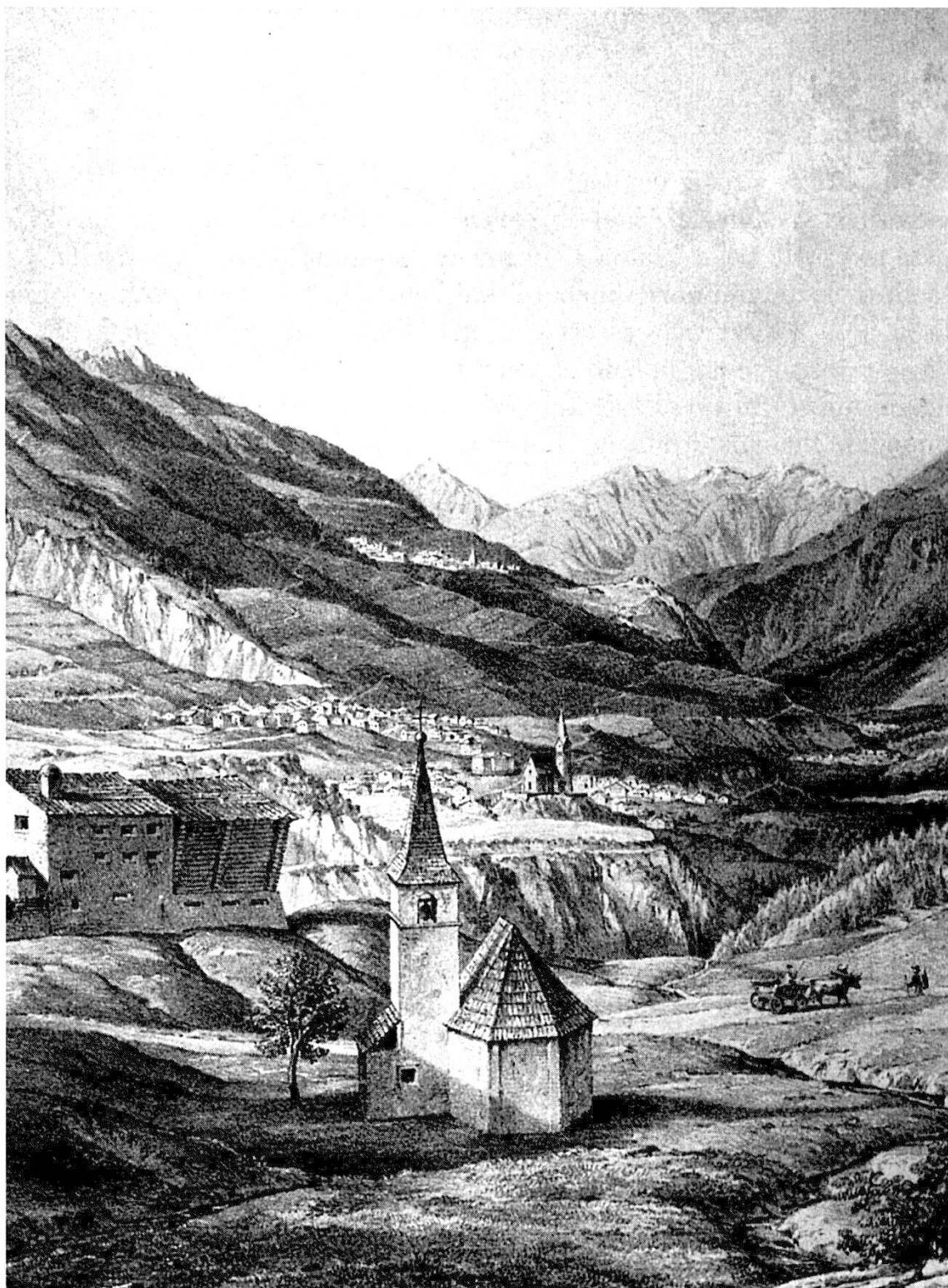
Gravura da Vulpera vers Scuol e Sent, intuorn il 1830

clostra da chasa dals signuors da Tarasp, la quala as rechattaiva il prüm a Scuol, e davent dal 1146 a Munt Maria survart Barbusch 4 .