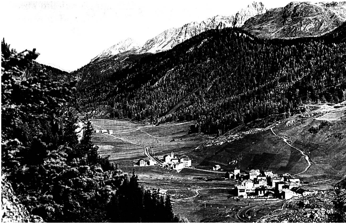
Marmorera, ni «Murmarrera»

La caldera dalla val avant tgi tot è 1954 nia mess sot l'ava.