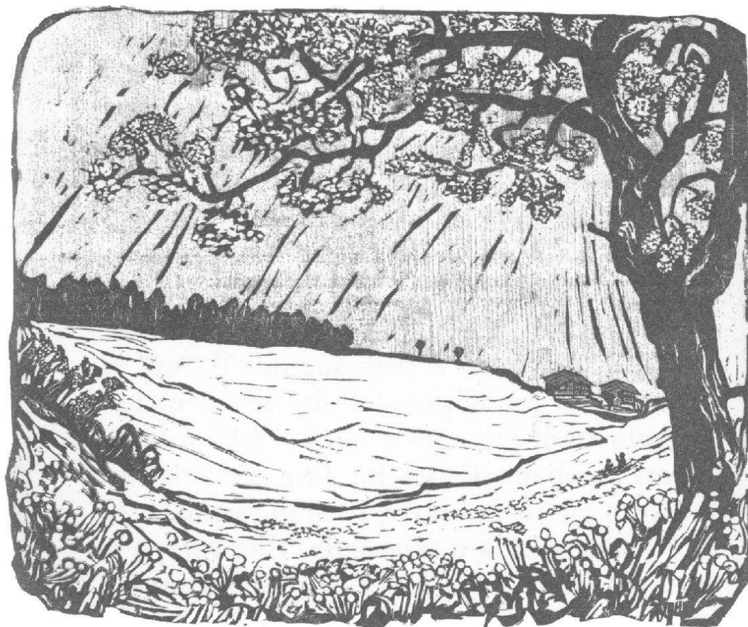
Plaun dil Busch e casa paterna a Cavorgia (maletg d'entagl da Hansueli Holzer ord Batterdegls 1980:28)

Tonca jeu sun vegnius siaden els onns – avon che saver sedecider. E po mirei, cheu ei mia historia cuorta el dialect dalla Val Tujetsch.