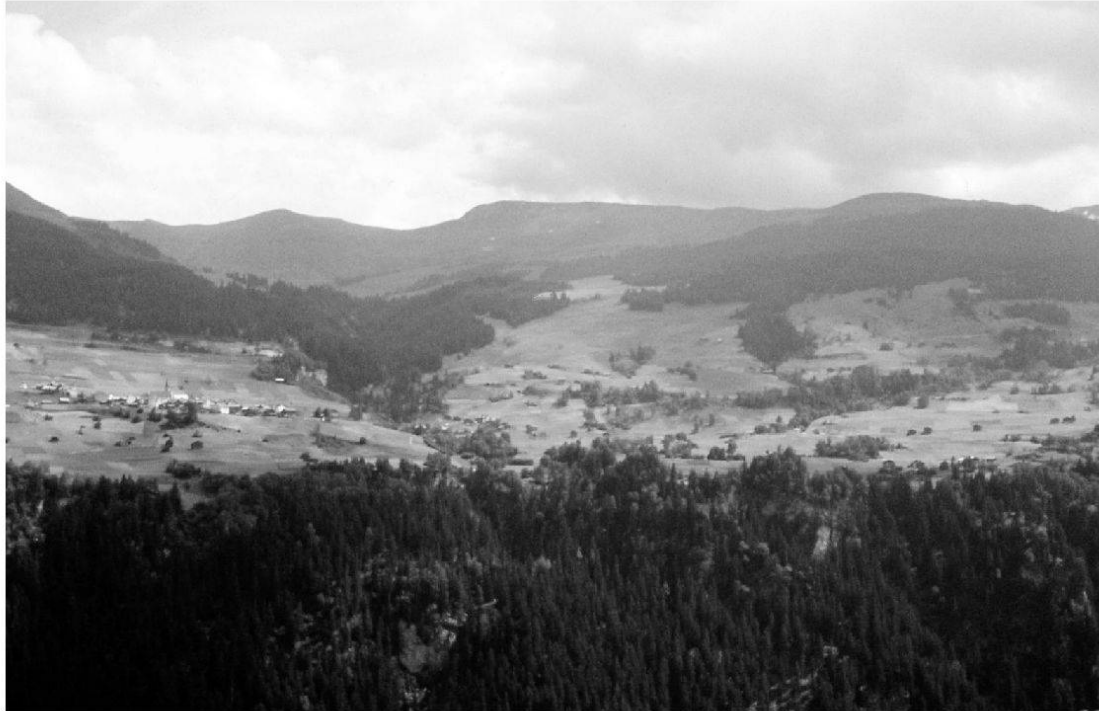
Sursaissa, Sursaissa tudestga u Obersaxen