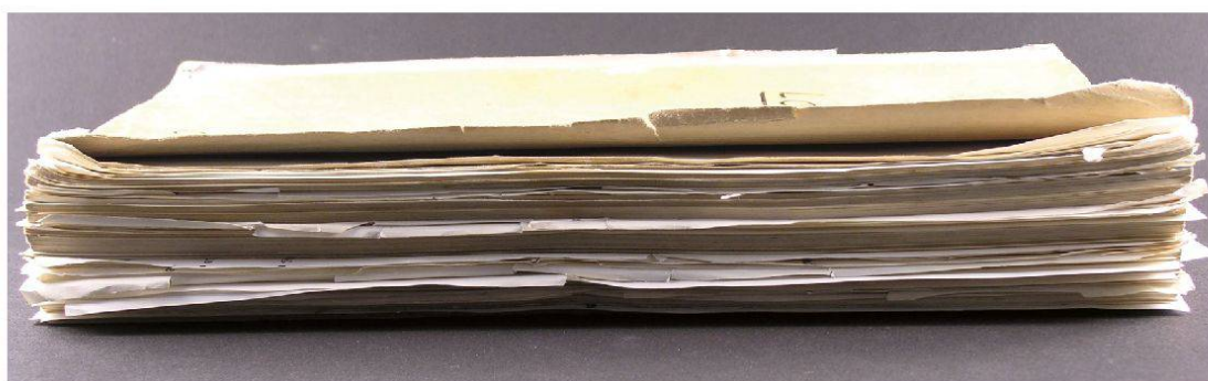
Ill. 2: Detagls dal tipuscrit aunz la restauraziun: La rain ed il tagl laterel

Il paraissait souhaitable de revenir à l'état dans lequel se trouvait cet objet lors de son arrivée dans nos collections, sans dépasser cette limite, sans «réparer» des dommages ou modifications survenus lors de l'utilisation par l'auteur lui-même et que l'on peut qualifier d'originels.