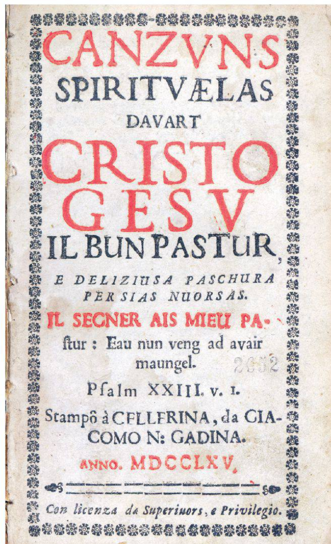
G. B. Frizzoni: Canzuns spirituaelas, 1765, frontispizi

ella fa part da la musica vocala sacrala cumpilada eclecticisticamain e da la musica da diever concepida per finamiras teologicas e pedagogicas.