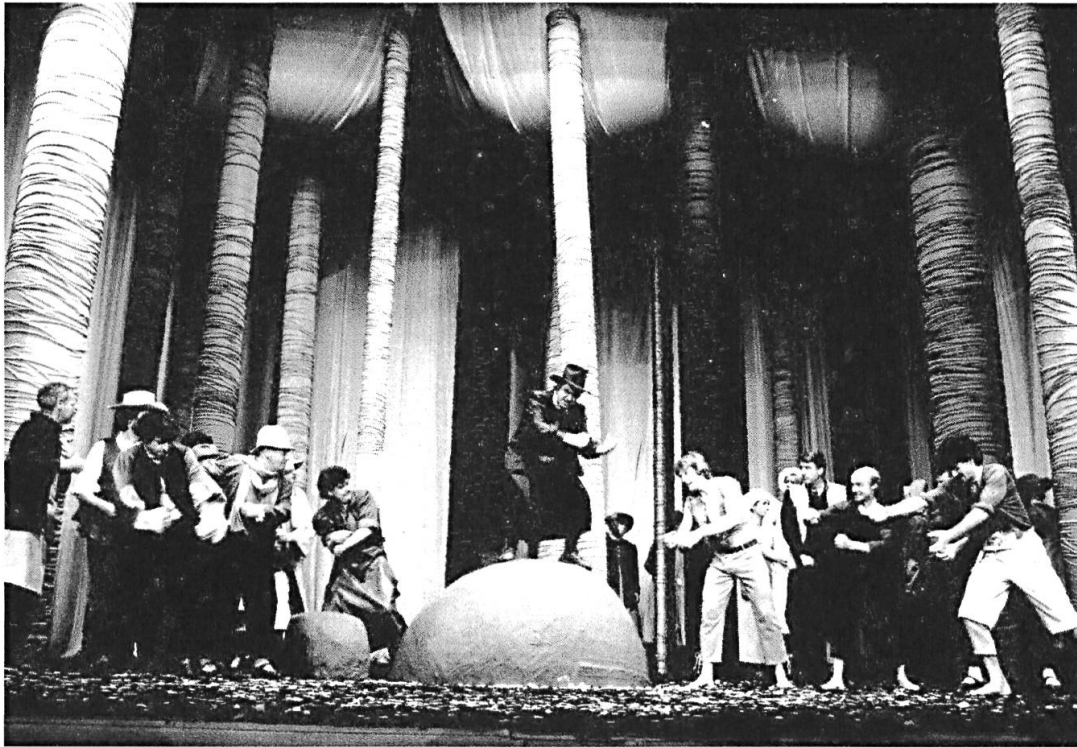
Primaudiziun da l'opera «Il cherchel magic» (op. 101, 1984) da Gion Antoni Derungs, teater municipal da Cuir, 1986.

medem mument la ferma identitad linguistica dals Rumantschs sco era il context cultural ed istoric da la Rumantschia. La pitga principala ed il colliament da la musica rumantscha uschè multifara èn pia las chanzuns rumantschas or dals differents geners da la musica tradiziunala, populara ed artistica, ma oravant tut mintga furma da chant collectiv che sa basa sin las tradiziuns culturalas (imaginadas) da la Rumantschia. Per il cumponist rumantsch Gion Antoni Derungs han questas tradiziuns culturalas rumantschas perfin furmà ses vair «da casa», ed el las ha integrà sco nagin auter en la musica artistica – tranter auter en l'emprima opera rumantscha Il cherchel magic . Cun questa muntada e funcziun è la musica rumantscha dentant destinada da vegnir chargiada cun ideologias e mitus, e da quai – surtut dal maletg da la musica sco expressiun u spievel da «l'orma rumantscha» – han profità ils divers moviments culturals, naziunals e confessiunals sur ils tshientiners. Lur stentas per ina unitad ed identitad culturala ha alura cleramain influenzà l'essenza e l'istorgia da la musica rumantscha. En l'appel «chantai rumantsch!» sa concentrescha pia lur imaginaziun cuntinuanta d'in'identitad (musicala) rumantscha. In'unitad musicala rumantscha n'han ils moviments dentant mai cuntanschì, fin ad in tshert punct è la musica rumantscha adina restada independenta ed è sa sviluppada libramain.