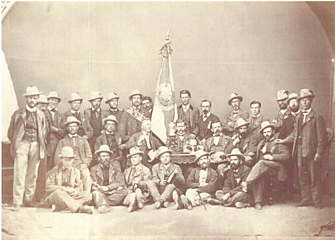
Chor viril Ligia Grischa, 1870.