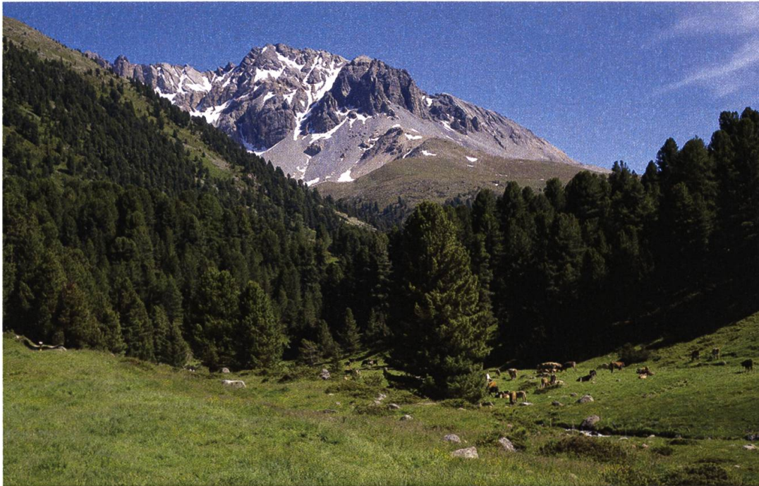
Guaud da schembers en la Val S-charl.