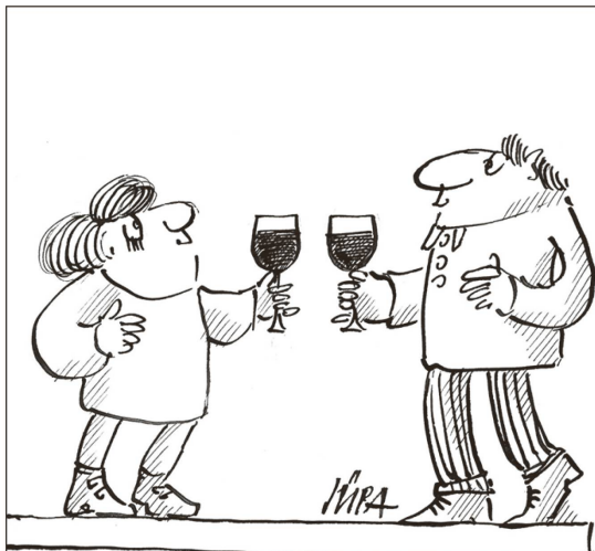
la situaziun «vin-vin»