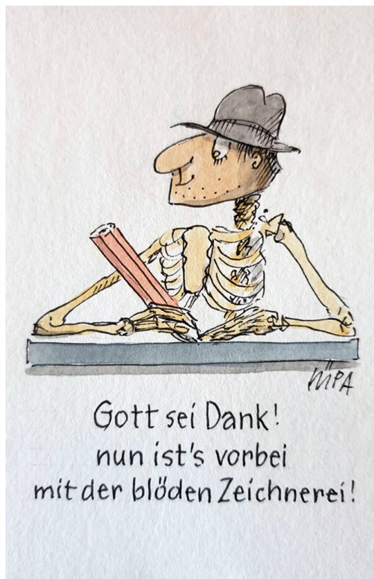
Gott sei Dank! nun ist's vorbei mit der blöden Zeichnerei!