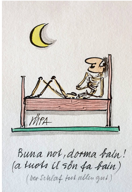
Buna not, dorma bain! (a tuots il s'òn fa bain) (Der Schlaf tut allin gut)