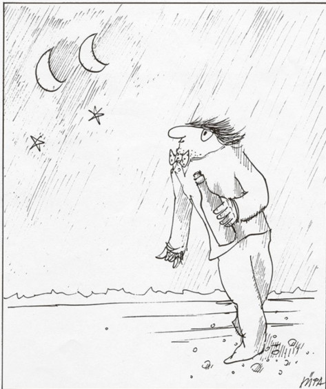
In vino veritas - o bella scha be da stuorn s'vegn our cun ella. (Artur Caflisch)