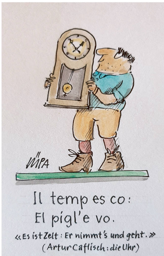
Il temp es co: El pigl'e vo. «Es ist Zeit: Er nimmt's und geht.» (Artur Caflisch: die Uhr)