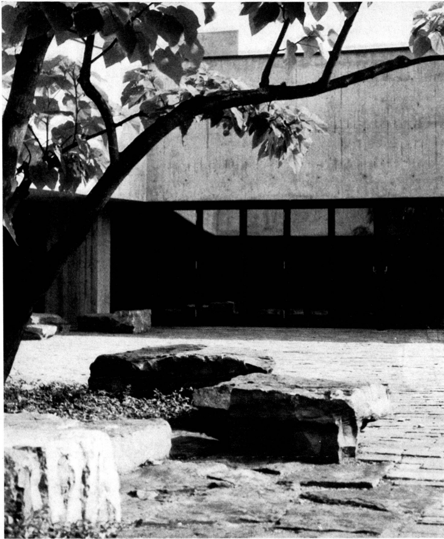
Anlage zum Kirchgemeindehaus in Thalwil/ZH. Dreiklang aus Architektur, wilden Steinblöcken und Vegetation. Gestaltung: E. Baumann, Gartenarchitekt BSG/SWB, Thalwil/ZH.