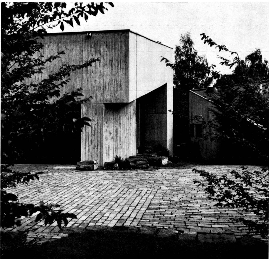
Park of the Thalwil/Zurich parish house. With a wide and subdivided paved area, the garden architect created a counterweight to the heavy architectural unit. Design: E. Baumann, garden architect BSG/SWB, Thalwil/Zurich.