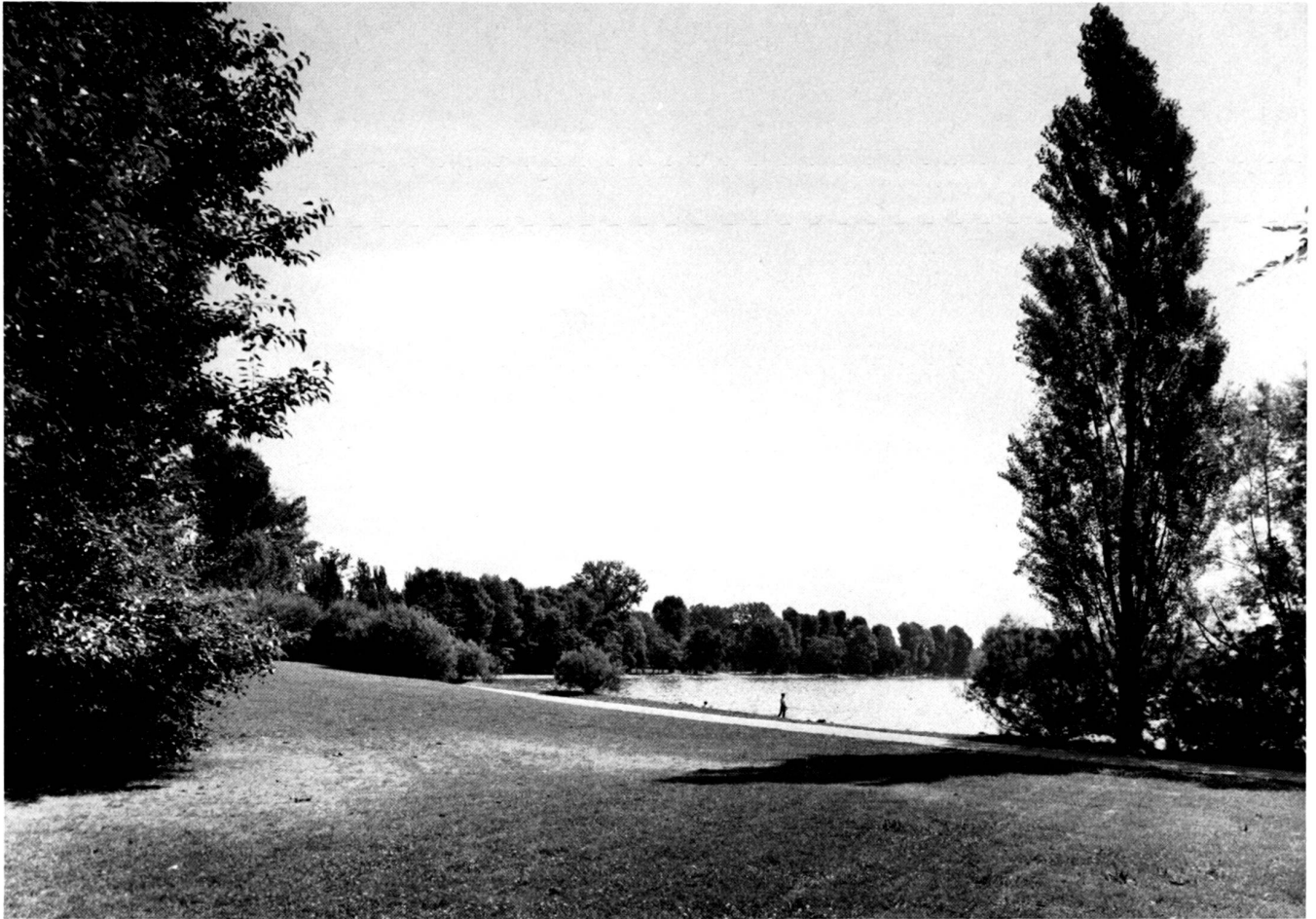
Oben: Vidy, der Bourget-Park als Vogel-Reservat, 1960.