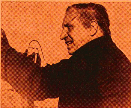
Prof. Dr. Roland Rainer

Zum neuen China-Buch von Roland Rainer Bereits in seinem 1972 erschienenen Buch über «Lebensgerechte Aussenräume» (Artemis-Verlag, Zürich) hat sich Roland Rainer als Befürworter eines sich weitgehend auf östliche Vorbilder berufenden städtebaulichen Konzepts vorgestellt. Dem von Gebäuden umschlossenen Grünraum misst er dabei grösste Bedeutung zu.