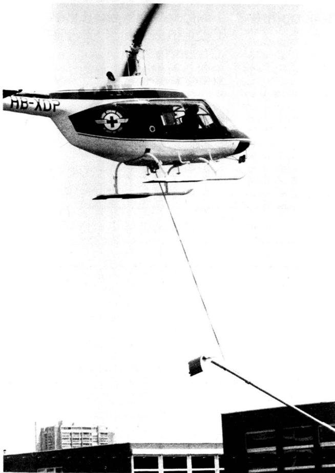
Links: Anfliegen der Beleuchtungsmasten mit dem Helikopter.