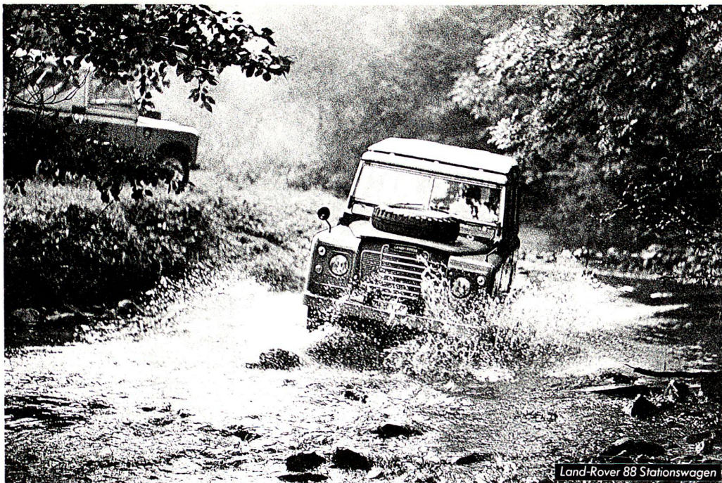
Land-Rover 88 Stationswagen