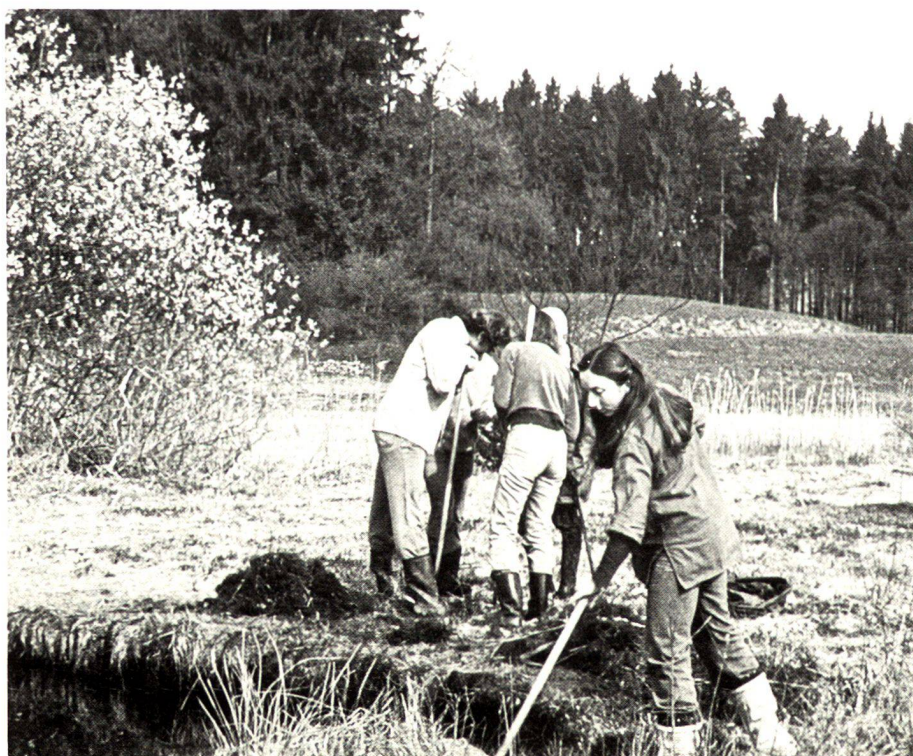
ITR-Studenten bei der Pflege eines Naturschutzgebietes.

Landscape planning Lenggis/Jona (Canton St. Gall). Emphasis: reduction of the building zones from the landscape plan-