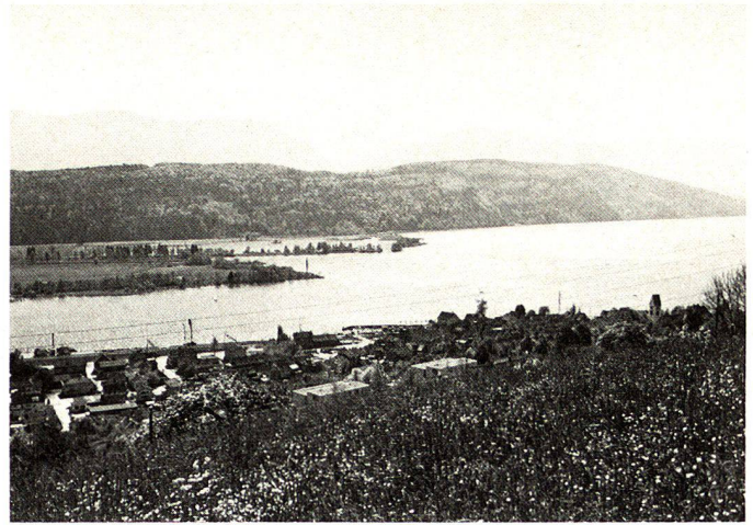
Région d'exercice Schmerikon – conflits entre des zones d'habitation et industrielles surdimensionnées, construction des routes, exploitation de gravier, remblayages, protection de la nature, préservation du paysage, utilisation récréative, agriculture etc., rives partiellement inaccessibles et non-aménagées.