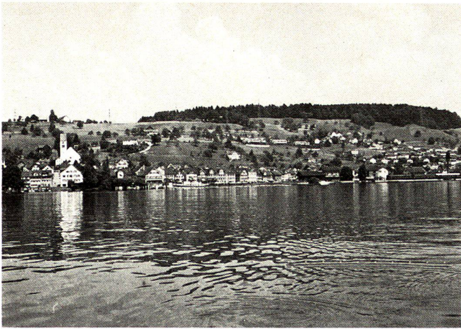
Übungsgebiet Schmerikon – Konflikte zwischen überdimensionierten Wohn- und Industriezonen, Verkehrsanlagen, Kiesabbau, Aufschüttungen, Naturschutz, Landschaftsschutz, Erholungsnutzung, Landwirtschaft usw., teilweise unzugängliche und ungestaltete Seeufer.