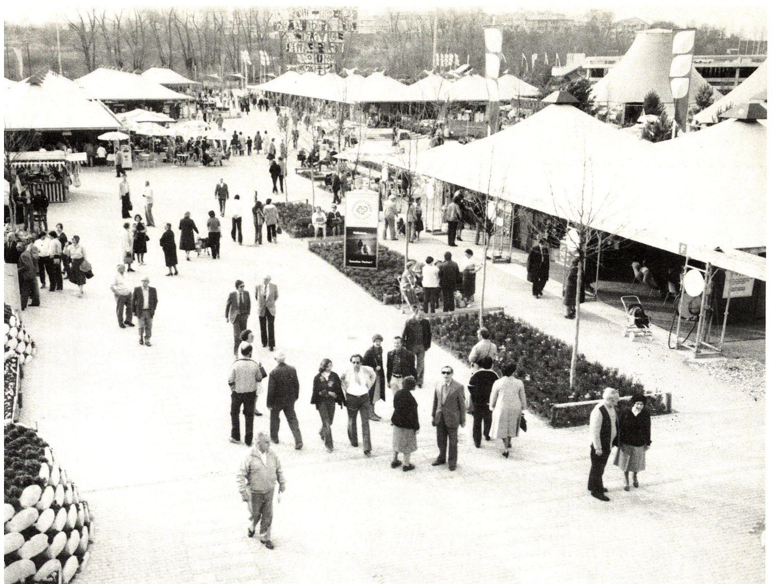
Der Sektor «Markt» der Grün 80 – ein Markt, dem leider durch sogenannte Sachzwänge die ursprünglich vorgesehenen «grünen Akzente» zugunsten eines Allerweltsangebots verlorengingen.