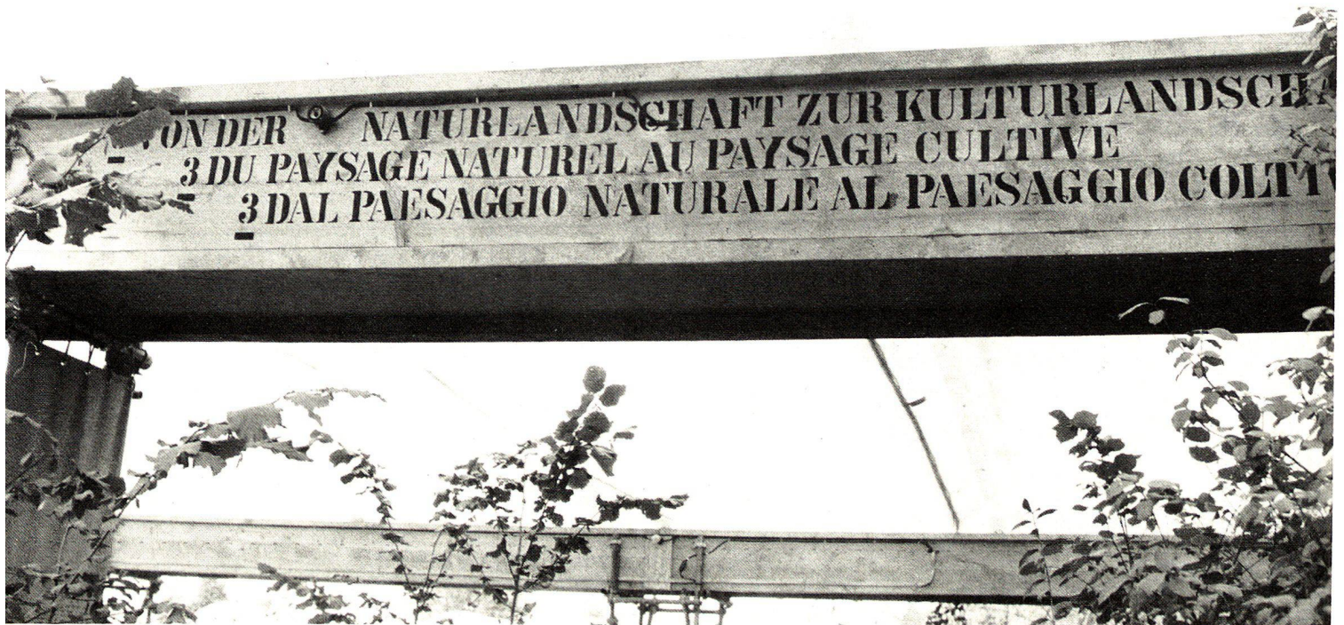
From the natural landscape to the cultivated landscape – the difficult sphere of activity of the landscape architect. Caption in the "Earth" sector.