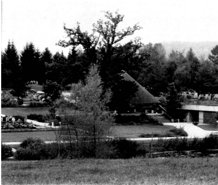
Links: Überblick vom Aussichtspunkt nach Westen. Den Abschluss bildet die Baumkulisse des alten Friedhofs.