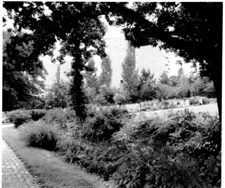
A gauche: Vue sur l'ouest à partir du belvédère, délimitée par la rangée d'arbres de l'ancien cimetière.