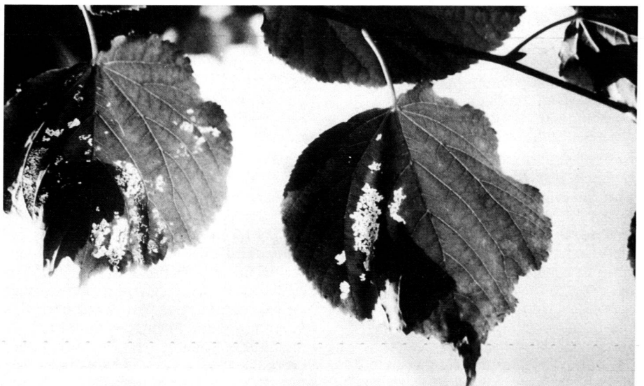
Fig. 5: Leaves infested by the lime-leaf wasp. The upper epidermis remains intact (creating a window-like effect), whereas the remainder of the leaf tissue is eaten by the larve. Photo H. Kühnen

Fig. 5: Une ajourure provoquée par la guêpe des feuilles de tilleul. La couche supérieure de l'épiderme n'est pas atteinte, alors que le reste du tissu de la feuille est dévoré par les larves. Photo H. Kühnen