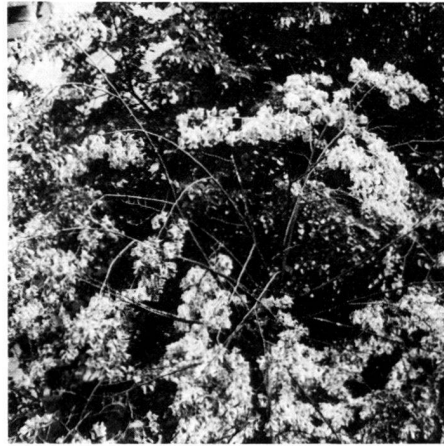
Abb. 2: Vergilbung und Absterben einzelner Äste (links) sowie partielles Absterben einzelner Kronenpartien (rechts) bei Tilia spec. Die Ursache dafür kann sowohl in einem Prachtkäferbefall liegen oder phytopathologischer Natur sein (Pilzbefall?). Aufnahme am Riehenring, H. Kühnen