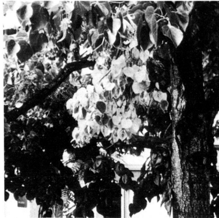
Fig. 2: Yellowing and dying-off of individual branches (left), as well as the partial dying off of individual parts of the crown (right) on tilia spec. The cause of this may be due to infestation by buprestis or be of phytopathological nature (fungus growth?). Photo taken at Riehenring, H. Kühnen