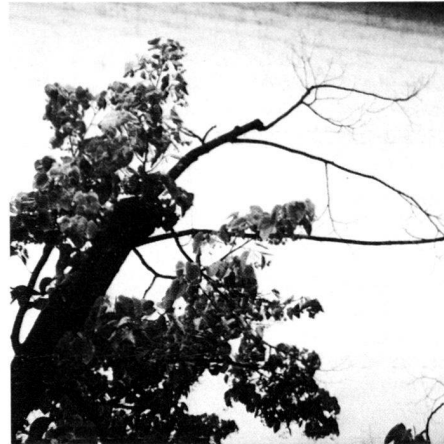
Abb. 3: Vergilbung (links) und Absterben (rechts) einzelner Äste bzw. Astpartien.