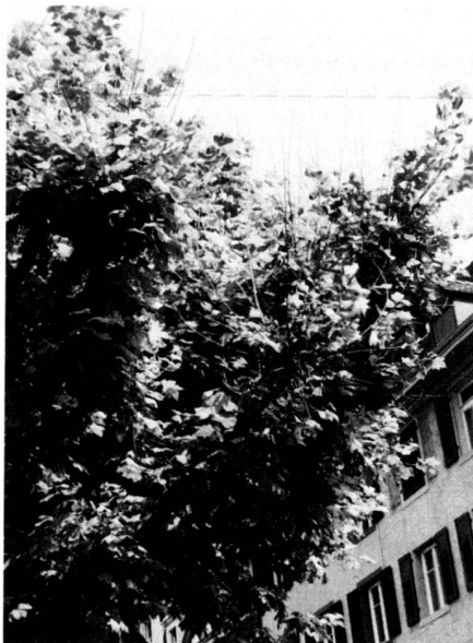
Photo taken at St.-Alban-Rheinweg