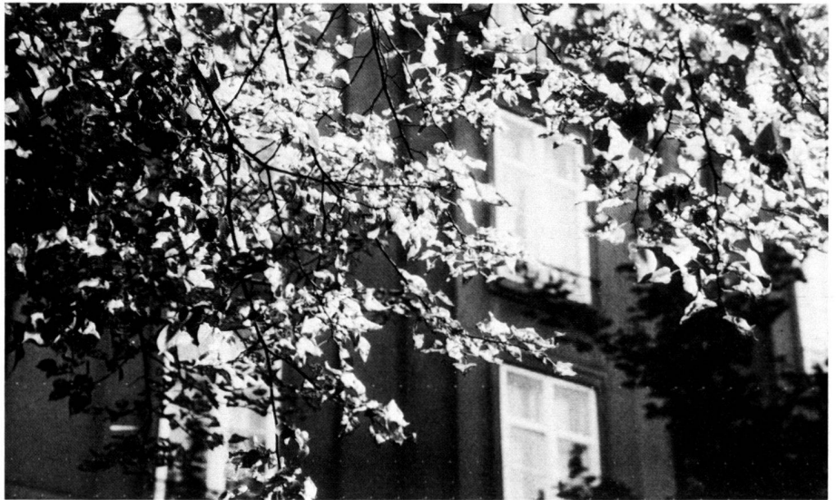
Fig. 4: Typical eating away of the tissue of leaves on a lime caused by caliroa annulipes which in extreme cases can lead to the complete destruction of the foliage. Photo taken at Wettstein-Allee, H. Kühnen

wiesen starke Frassschäden durch die Lindenblattwespe ( Caliroa annulipes , Trockenheitszeiger) auf (Abb. 4 und 5). Ebenfalls als Anzeichen von erhöhtem Trockenstress bei der Linde muss der auffallende Befall der Linden mit Prachtkäfern ( Agrilus auricollis , Lampra rutilans ?) gewertet werden, die teilweise zu erheblichen Astdürren, insbesondere am Riehenring und an der Wettsteinallee, geführt haben (Abb. 2 und 3).