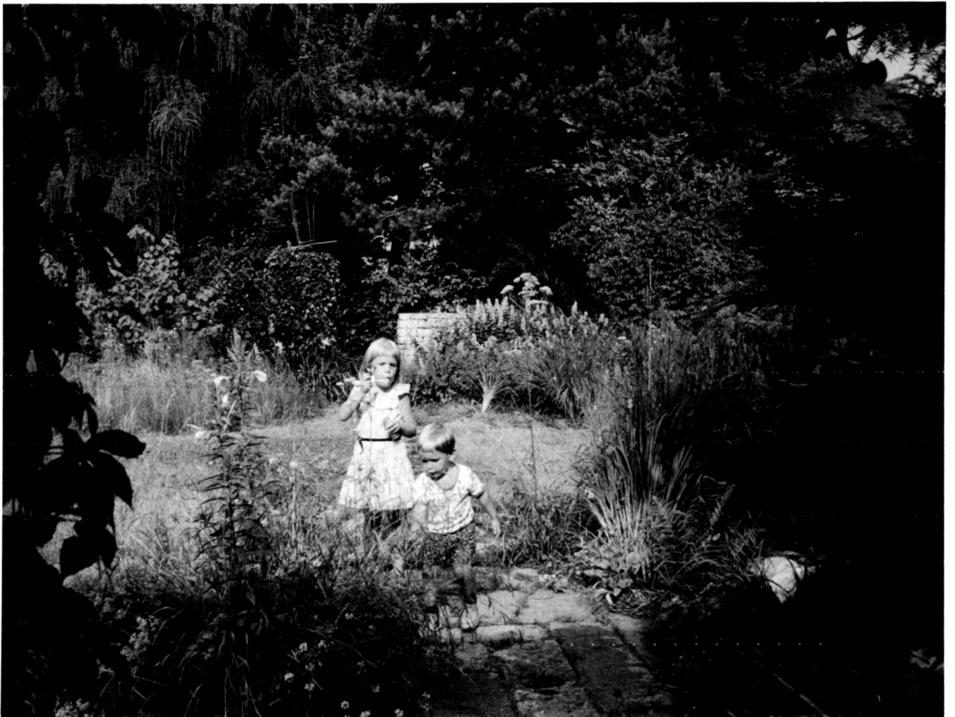
Below: Garden, planted in a natural manner (1984).