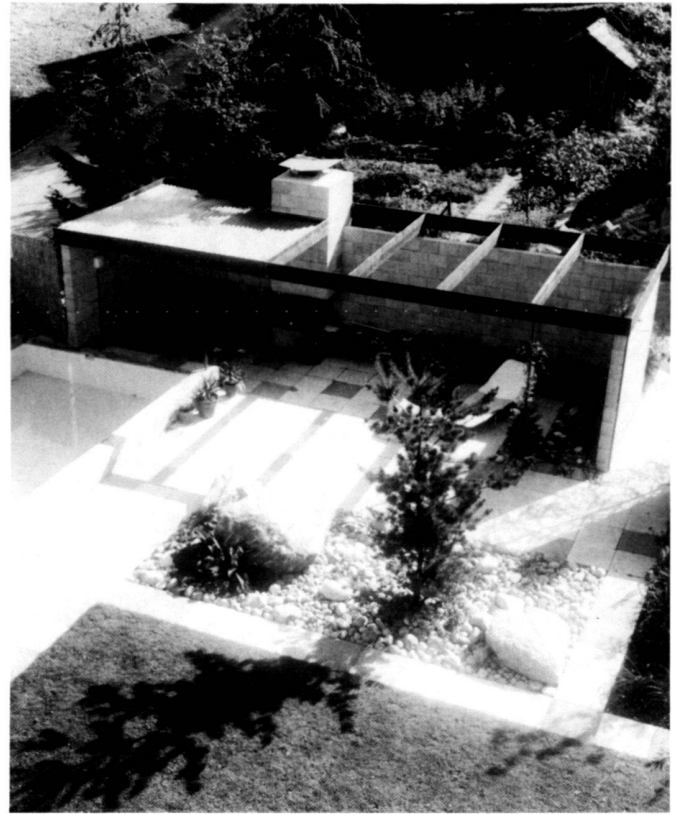
Left: The decorative water basin in front of the second apartment (1956).