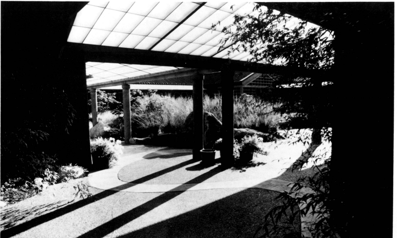
The inner courtyard of the "Center for Urban Horticulture" in Seattle, Washington.