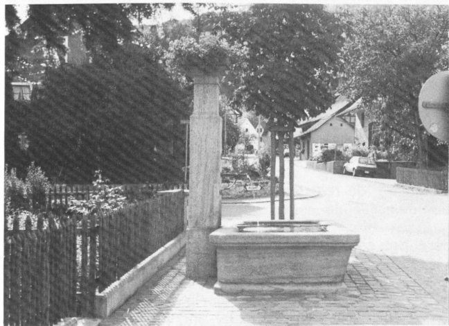
Links: Der Brunnen des Gasthofes Posthorn, restauriert und neu versetzt in die Nähe seines ursprünglichen Standortes.