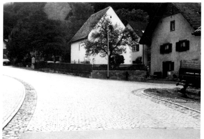
Dorfstrasse Neuenhof/AG. Bilder des neugestalteten Strassenraumes in der Abfolge von unten nach oben.