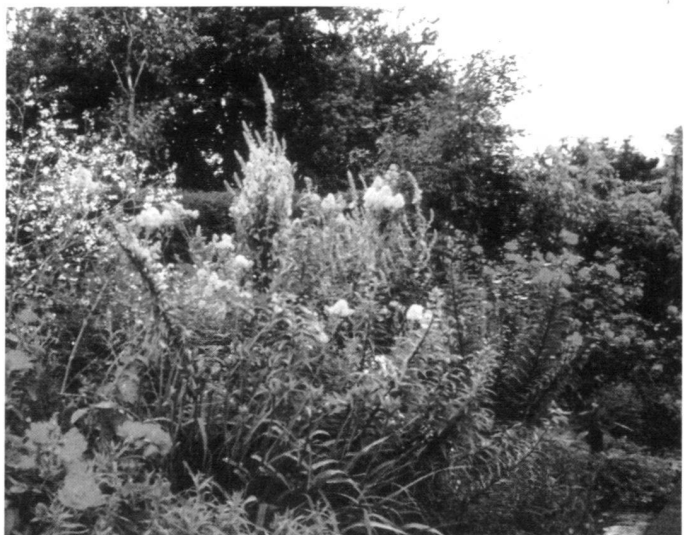
A gauche: Kitchen Garden.