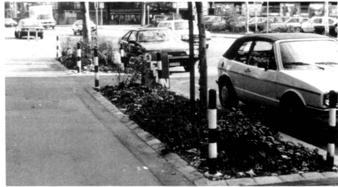
Left: Botanical Garden, St. Gallen, Department of Biology: Examples of spontaneous vegetation are shown alongside plants which are also utilised in garden planning.

A droite: Aménager le biotope des zones d'arbres d'une manière aussi naturelle que possible signifie aussi animer nos paysages urbains.