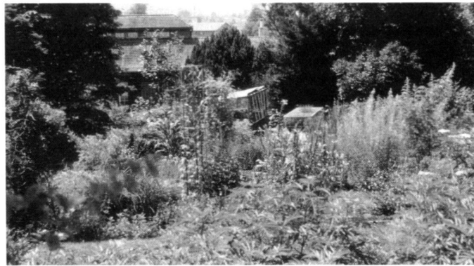
Links: Botanischer Garten, St. Gallen, Abteilung Biologie: Beispiele aus der Spontanvegetation werden neben Pflanzen gezeigt, die in der Gartenplanung Verwendung finden.

Right: Originally cotoneaster, now a varied bed of herbaceous plants. The only marginally higher costs for tending are not a factor preventing the re-design of such areas if compared with the positive effect.