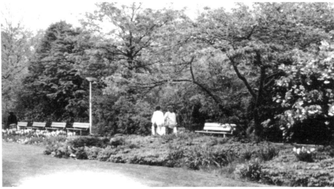
Links: Im Stadtpark St. Gallen bereichern bewusst geplante Beetstaudenpflanzungen in gestalterischer Verbindung mit Wechselblorbeeten die öffentliche Grünanlage in ihrer Vegetationsvielfalt.

Rechts: Früher Cotoneaster, heute eine vielfältige Staudenrabatte. Die unwesentlich höheren Pflegekosten sind im Vergleich zur positiven Auswirkung kein Verhinderungsfaktor für die Umgestaltung solcher Flächen.