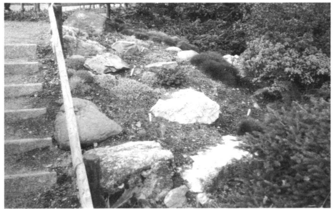
A gauche: La montée du sud, 1984. A droite: L'«alpinum» dans l'alpinum, 1989.