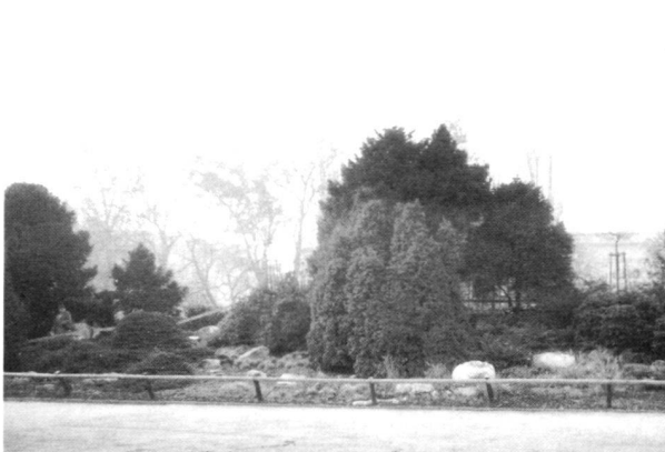
Gesamtansicht. Links das «Alpinum», rechts das Bürkliendenkmal hinter den Säuleneichen. 1989.