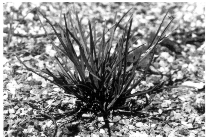
Left: In this cemetery, gravel paths have to be kept free of weeds.