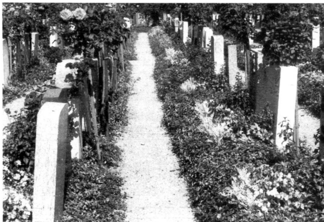
Links: In diesem Friedhof müssen bekieste Grabwege unkrautfrei gehalten werden.

Successively flowering plants hardly need to be treated in cemeteries as they generally arrive there "clean". Only