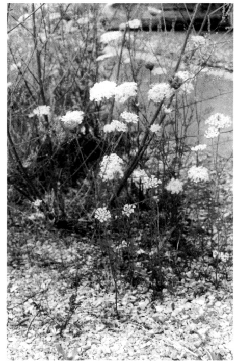
Left: Building in existing structures means that account has to be taken of the verdure substance ... in a villa garden