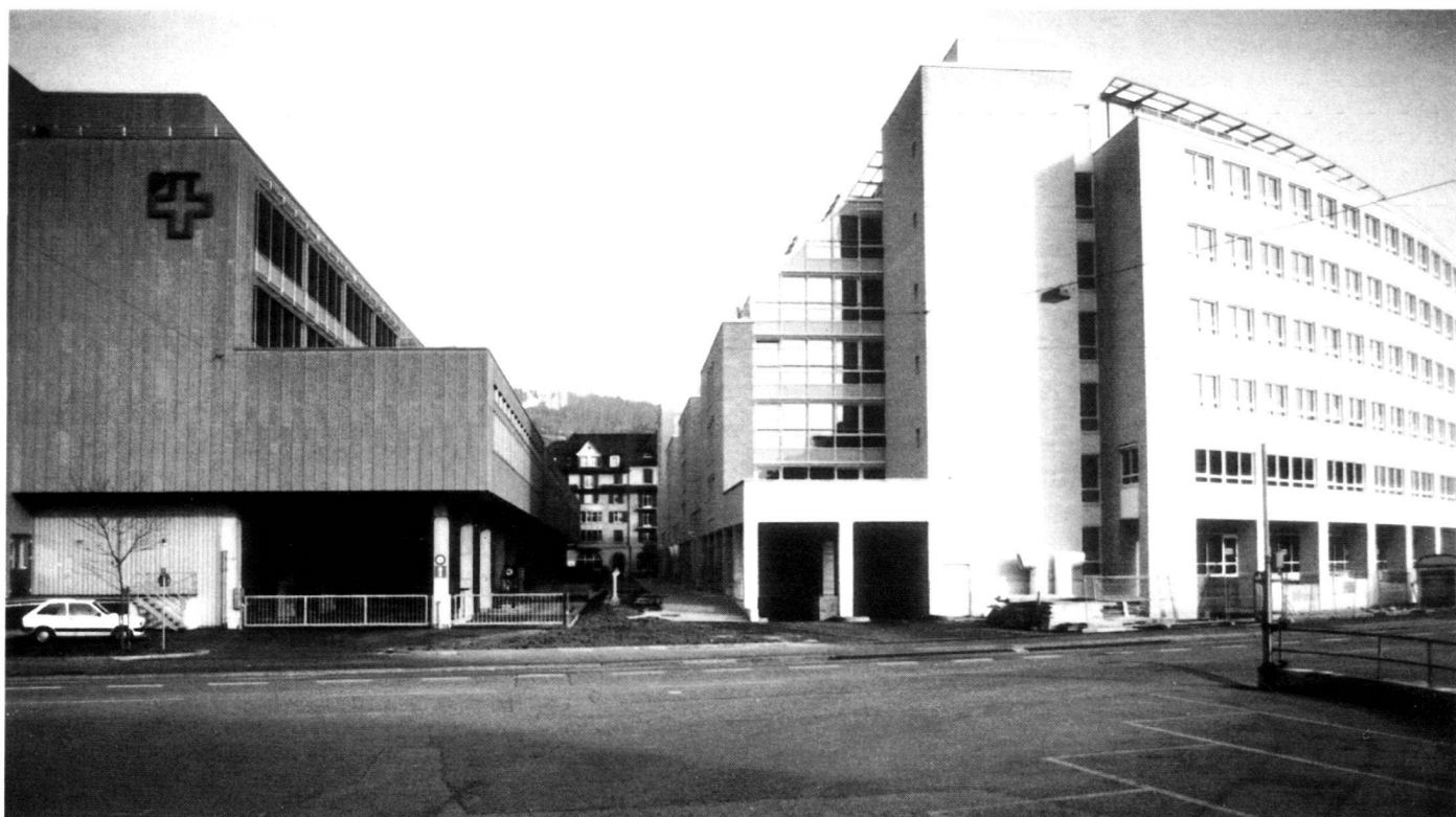
Unterbauen von Parzellenrand zu Parzellenrand, Zürich-Industriequartier.

There is also a relaxation in the separation made between utilisations up to now. A new feature of § 357 of the PBG is that existing utilisations alien to the zone do not just acquire a guarantee of existence, but also the opportunity of expansion. To-