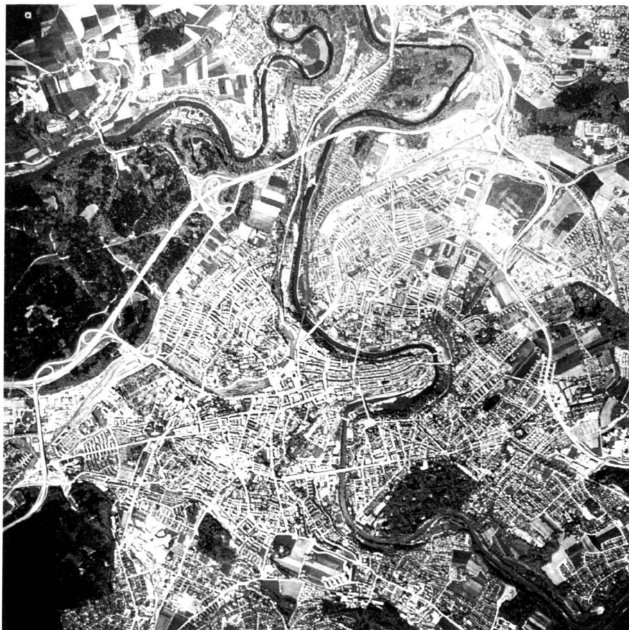
Luftbild der Stadt Bern. 1984.

Berne City Gardens Department maintains a total of 385 ha of green open spaces (some 30 m 2 /per inhabitant). If the forests are also included, there are approx. 150 m 2 of green open space for leisure and recreation available for each inhabitant.