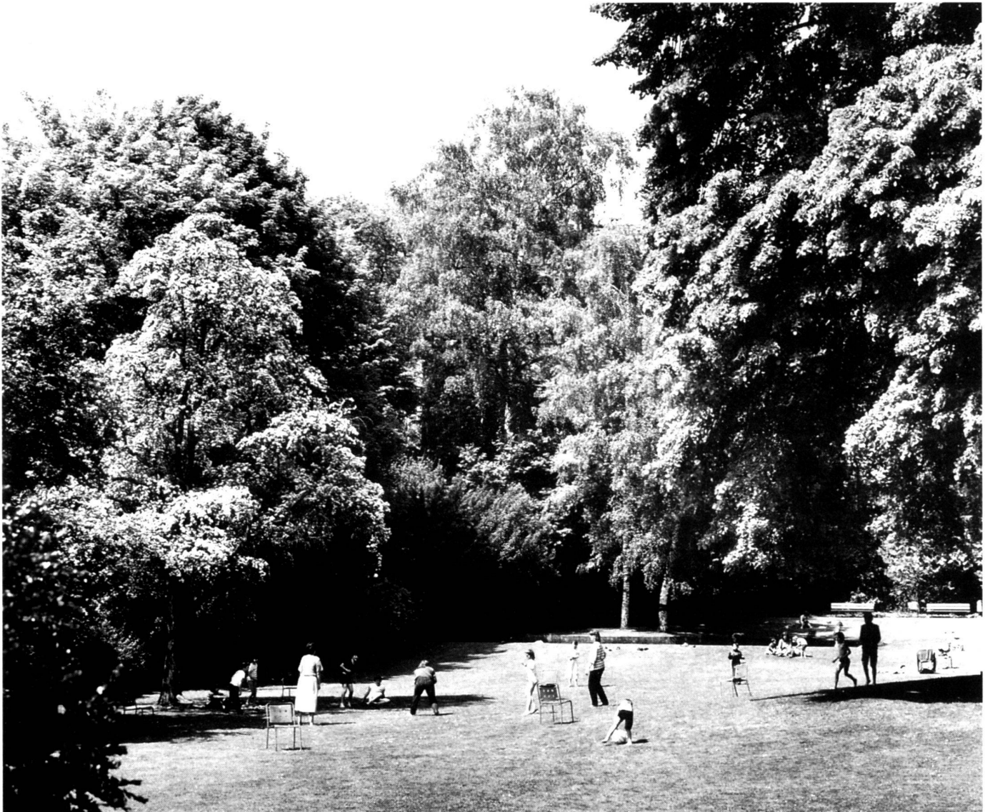
Kocherpark in Bern.

Lucerne Conference in 1993 were essential stages for initiating a coherent approach on an international level. It is the political institutions' rôle to translate this into concrete measures at a local level. Let us take the case of Municipal Management of parks and gardens: a maintenance of green zones without the use of pesticides, a permanent effort at enlarging these areas of rest, or the proposals ventured for renaturing a river passing through a city are further measures which can make a city more beautiful or agreeable to live in. In order for these visions of the future to be realised, we need you, the experts. We need your commitment, your intelligence, your experience, your sensitivity, your boldness even in order for city, nature and future to become united as key elements for a new social contract which we must define together and put forward to the inhabitants of this beautiful country.