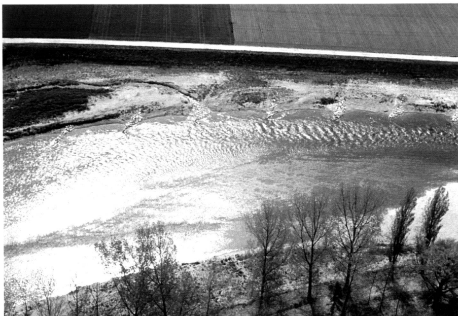
Abb. 7: Etappe III. Flussaufweitung mit Bühnen als Ufersicherung. Die Struktur der Wasseroberfläche zeigt das neue, vielfältige Strömungsverhalten.

The enhancement measures can be integrated into the measures for protection against flooding. They must be employed specifically for the location and river concerned. A thorough knowledge of the stretch of water, the vegetation and the animal world are the prerequisite for this. The stretch of water reacts very directly and diversely to structural interference. Surprises are quite possible.