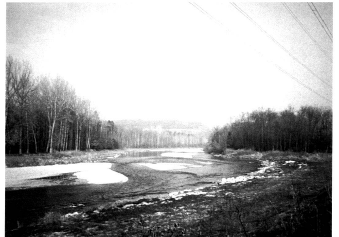
Fig. 5 et 6: Etape III. Après un vaste élargissement du profil et un rabaissement du saillant, des bancs de gravier sont apparus et se sont constamment déplacés. (à gauche en 1992, à droite en 1993).