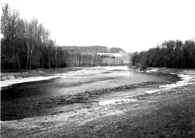
Abb. 5 und 6: Etape III. Nach einer grosszügigen Profilaufweitung und Vorlandabsenkung entstanden Kiesbänke, die sich immer wieder umlagern (links 1992, rechts 1993).

On the embankments and higher-lying forelands, the greenery is in the area of acute strain between safety from flooding and closeness to nature. Seed suitable for