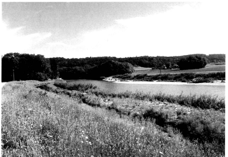
Fig. 9: Left embankment: In the second year after sowing, a semi-dry turf developed securing the embankment. Flood channel in the foreland.

Fig. 9: Berges de gauche: dans la 2 e année après l'ensemencement, il se développe un gazon demi-sec qui assure la berge. Rigole d'inondation dans le saillant.