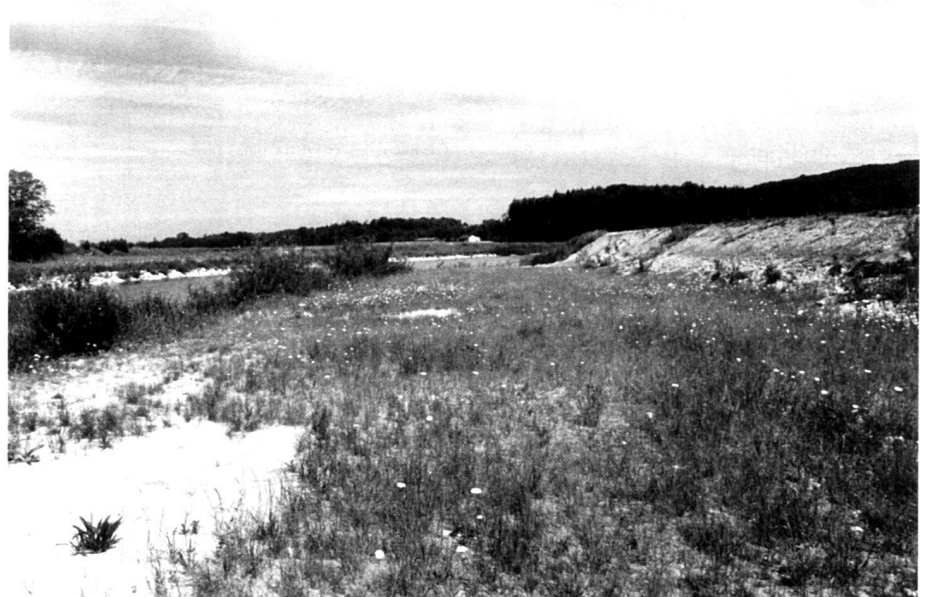
Abb. 9: Linke Uferböschung: Im zweiten Jahr nach Ansaat entwickelt sich ein Halbtrockenrasen, der die Böschung sichert. Flutrinne im Vorland.

Fig. 8: Sowing in mulch after two years: The foreland has only broken plant coverage. Traces of erosion on the embankments.