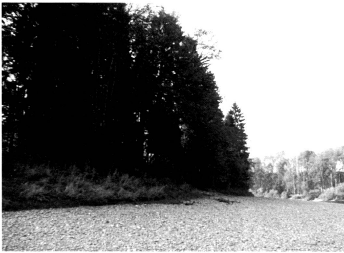
Abb. 3 und 4: Etape II. Nach Abtrag der Innenkurve und nach Veränderungen des Gerinnes flussaufwärts schuf die Thur eine Steiluferpartie.