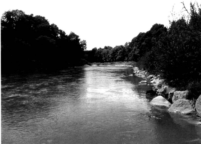
Abb. 1 und 2: Etape II. Blick flussabwärts: vor dem Bau (1989) und etwa drei Jahre nach Bauende (1994).