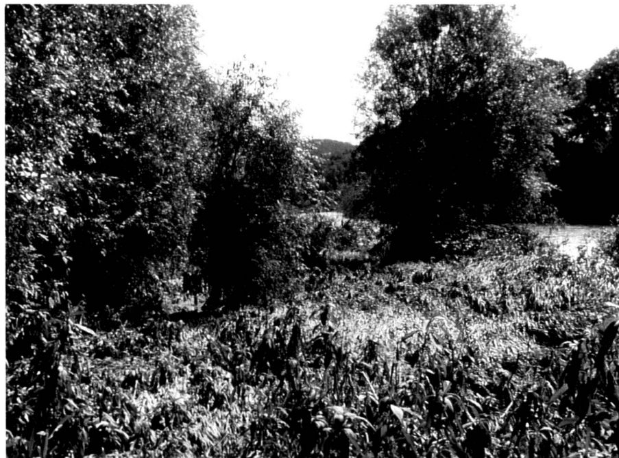
Abb. 10: Bildabfolge 1989, 1991, 1994: Natürliche Sukzession auf tiefer Vorlandfläche. Ohne Eingriffe entwickelt sich über Flutrasen- und Röhrichtgesellschaften eine Weichholzaue.