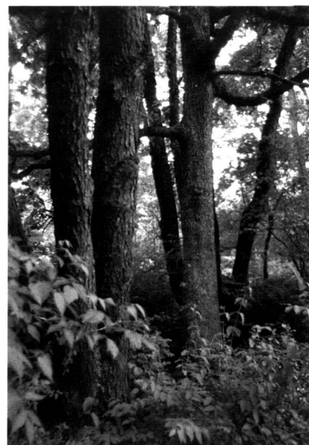
Existing White Oak trees in Tom Tudek Memorial Park.