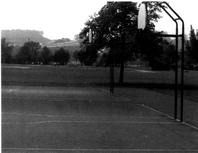
Sportanlagen sind heute dominierend in einem typischen Vorstadt-park. De nos jours, les installations sportives dominent dans un typique parc suburbain. Active athletic facilities in a typical suburban park.

The need to balance contemporary interests in active recreation with certain traditional park values, particularly of regional context, nature, and art, has been the goal of several park projects by Battaglia and