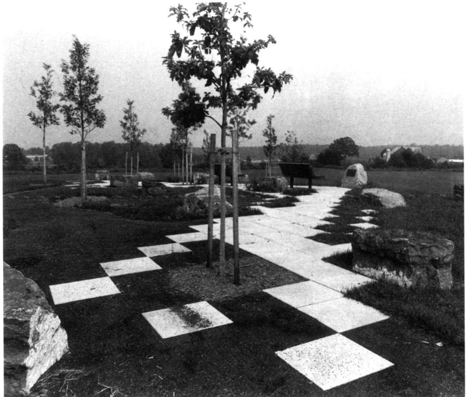
Die Tom-Tudek-Gedenkstätte bildet einen formalen Raum am Weg um den Park.

Am Rand ebenso wie im Innern des Parks wurde ein Wander- und Radwegsystem angelegt, das nicht nur die verschiedenen Parkbereiche miteinander verbindet, sondern auch an das regionale Wegnetz anschliesst. Ein über den höchsten Hügel führender Pfad durchschneidet die Tom-Tudek-Gedenkstätte. Hier umrahmen Eichen den Ausblick in die Ferne, während gewichtige Kalksteine die Szenerie im Boden verankern. Mit der Gestaltung dieses Ortes wurde versucht, die Menschen für einen rücksichtsvollen, würdigen Umgang mit der Landschaft zu gewinnen.