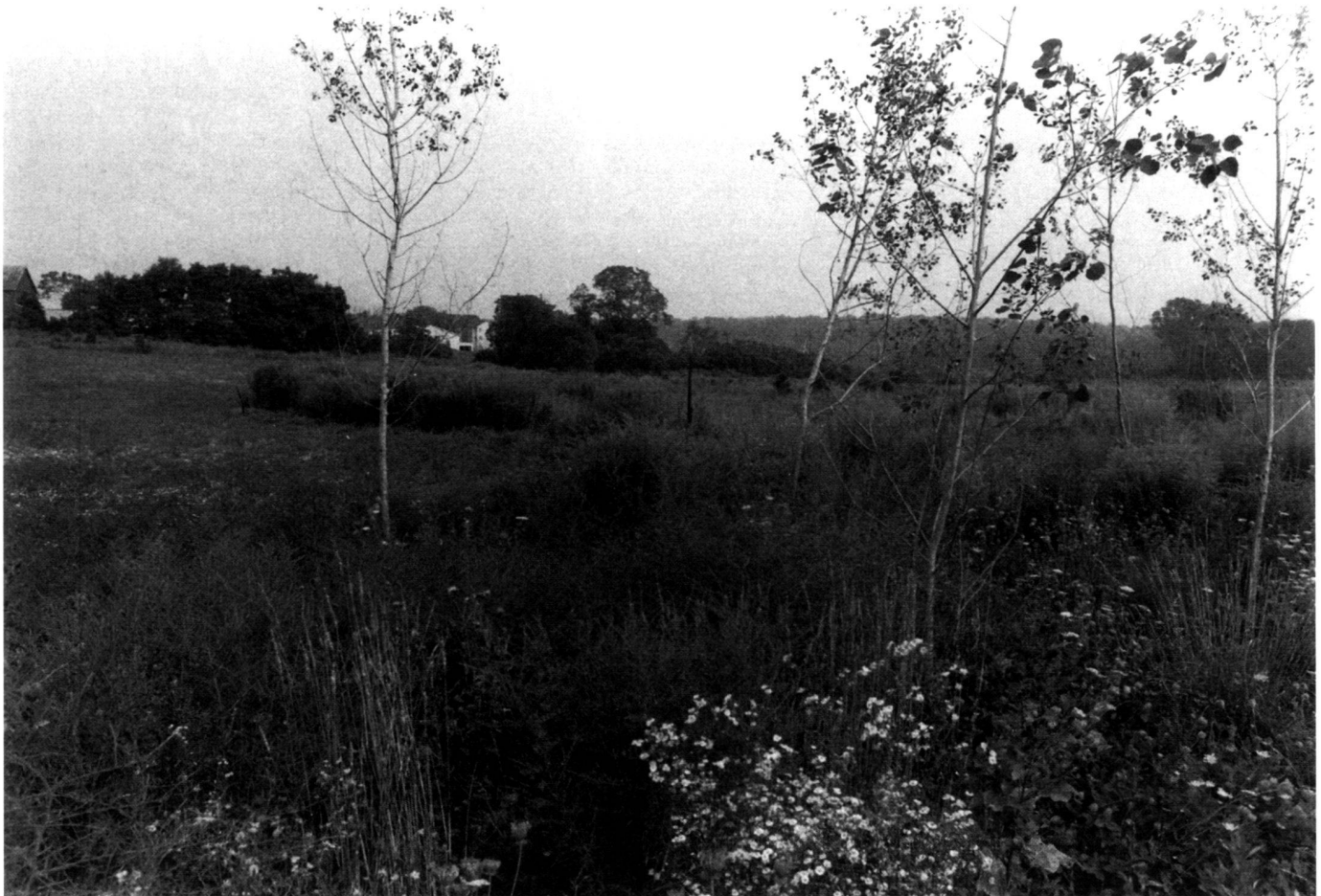
Neu bepflanzte Senke innerhalb ehemaliger Äcker des Tom-Tudek-Memorial-Parks.

Tom Tudek Memorial site is a formal space along the park perimeter path.