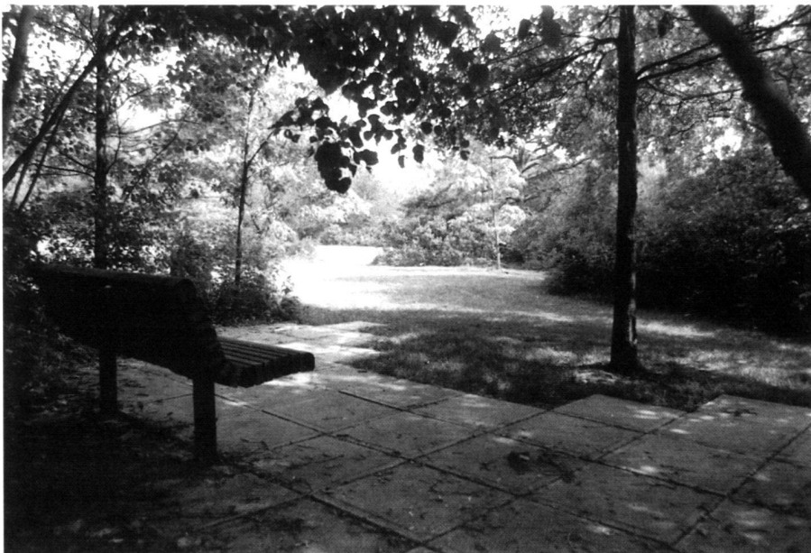
Sitzplatz entlang eines Pfades gegenüber der zentralen Wiese im Lederer-Park.

Conversions of agricultural fields to a wider diversity of vegetative covers on a minimal budget is a primary goal. While considerable expenses of landscape will re-