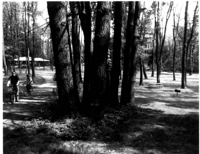
Picknickbereich und Wegnetz im Lederer-Park. Aire de pique-nique et réseau de sentiers au Lederer Park. Lederer Park picnic and path space.