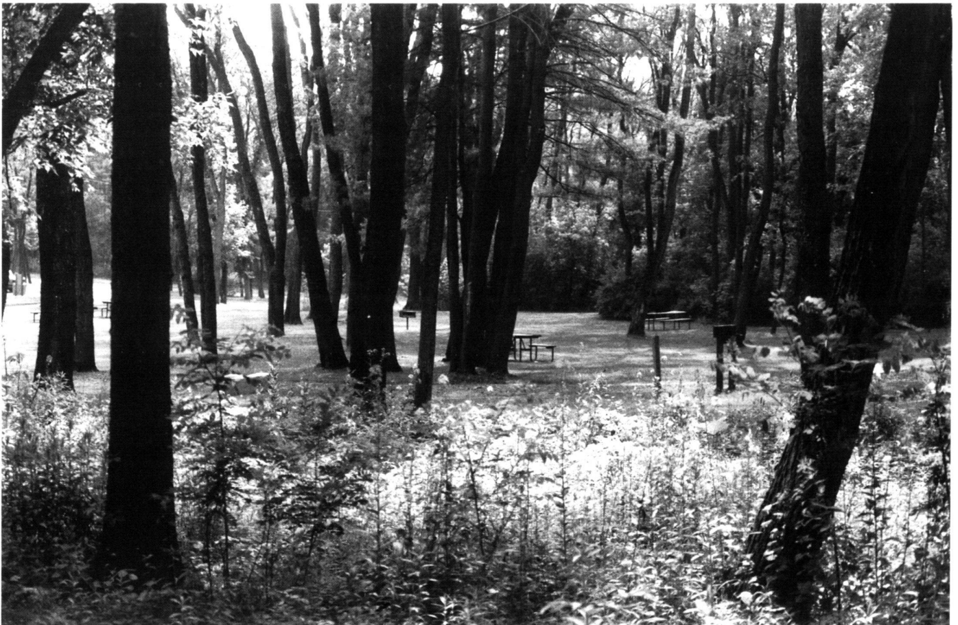
Rasen als Raum zur passiven Nutzung in einer Waldung im Lederer-Park.

Many aspects of the sprawling and seemingly unplanned American suburbs have been scorned by designers and planners, but welcomed by several generations of Americans who continue to move to suburban locations when they have a choice. Suburban parks have also evolved to reflect suburban lifestyles, and several distinctive patterns may be recognized.