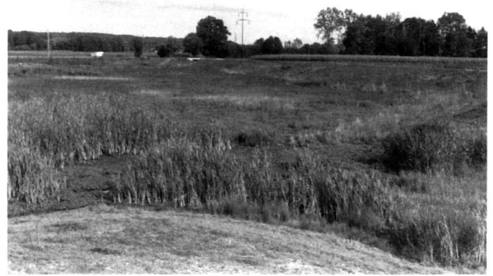
Le nouveau bassin de retenue «Wüeri» en voie d'être achevé. Attenant à l'ancienne gravière «Gheid» (devant à droite).