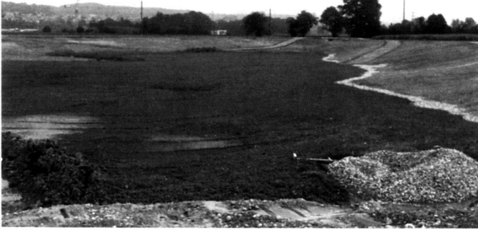
Das neue Rückhaltebecken «Wüeri» kurz vor und zwei Jahre nach der Fertigstellung. Unmittelbar vorn rechts schliesst die ehemalige Kiesgrube «Gheid» an.