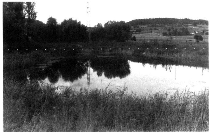
The vegetation along the banks and in the shallow water zone of the newly created expanse of water developed luxuriantly in the first 15 months without sowing or planting.

– Umleitung des Chilenwiesenkanals unter Umgehung des Baggersees.