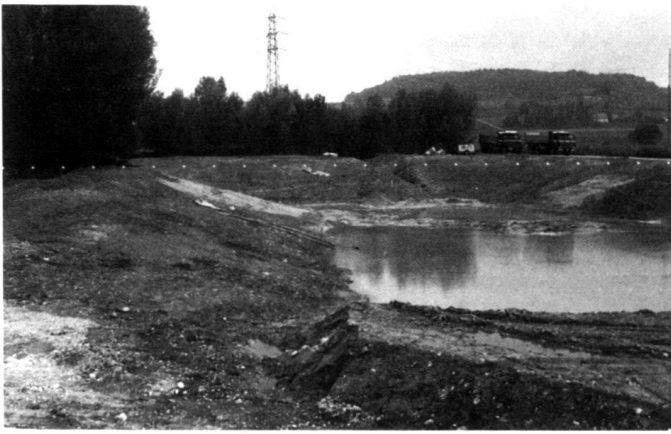
Ohne Ansaat oder Bepflanzung hat sich die Vegetation an den Ufern und in der Flachwasserzone des neu angelegten Gewässers in den ersten 15 Monaten üppig entwickelt.