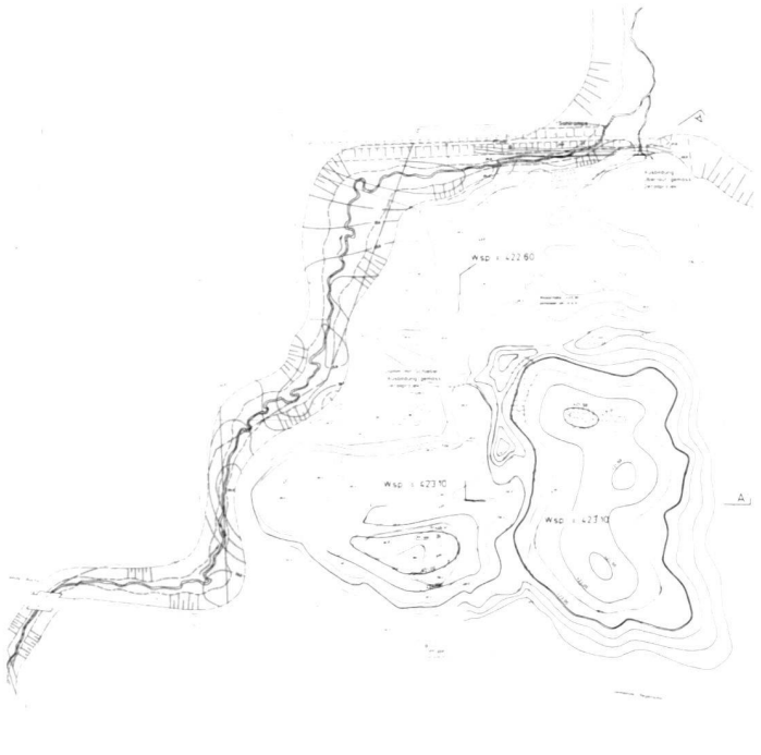
Im Vergleich das Vorlageprojekt 1987 (links) und das aufgrund der aktuellen Bestandesaufnahmen erarbeitete Gestaltungsprojekt 1992 (rechts) für das Areal der ehemaligen Kiesgrube «Gheid».