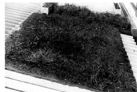
Die Versuchsfläche im Frühlings 1980.

The water retention and nutrient supply was fully sufficient for stable extensive planting with greenery. Only after several hours of rain did water flow out. In the event of heavy rain, just a little water flowed off the surface without washing out.