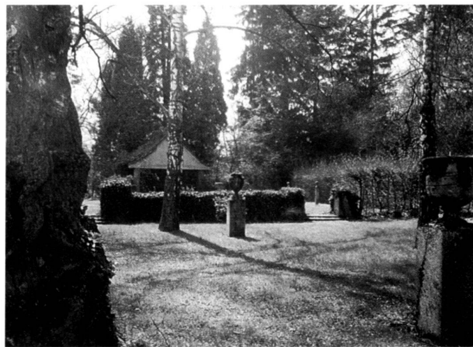
Zustand 1994. ▼