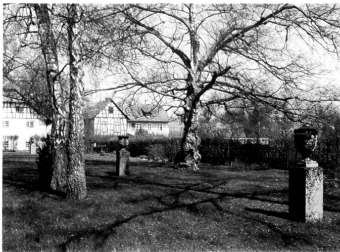
Zustand vor dem Eingriff. ▲