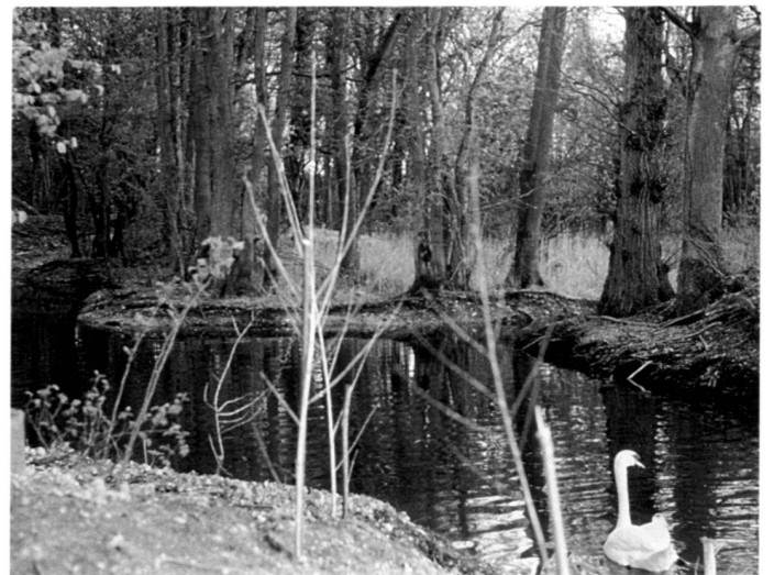
A gauche: Nouvelle rive plate et rigole d'eau intérieure à l'endroit de l'ancien mur de rive, printemps 1992.