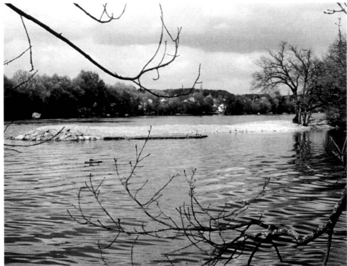
A gauche: Dans les années 70, la rive de roseaux s'étend encore jusqu'au poteaux de chêne plantés pour la protéger des bateaux, situation en été 1990.

Rechts: Die künstlich wieder ausgezogene Uferlinie als stabile Mole am Ort der alten Eichenpfähle, Frühjahr 1992.