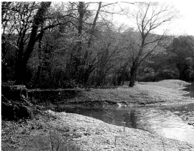
Links: Neu errichtetes Flachufer mit Einführung einer Binnenwasserrinne am Ort der alten Ufermauer, Frühjahr 1992.

Admittedly, in order to maintain the desired dynamic identity, about every twenty years the bulldozers will again have to duplicate what the untamed Rhine once used to model by itself.