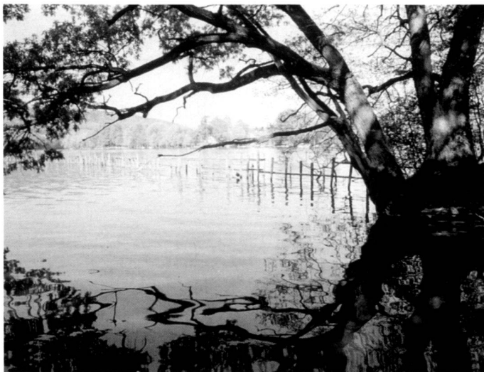
Links: Das Schilfufer erstreckte sich in den 70er Jahren noch bis zu den gegen eindringende Boote gesteckten Eichenpfählen, Zustand Sommer 1990.

Rechts: Die künstlich wieder ausgezogene Uferlinie als stabile Mole am Ort der alten Eichenpfähle, Frühjahr 1992.