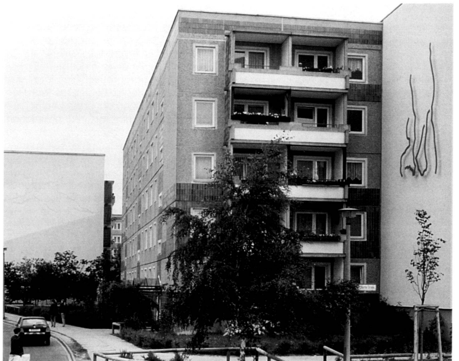
Künstlergiebel, Neudefinition eines öffentlichen Raumes, Künstler Klaus Schmidt.

Steel sculpture «The Draughtsman» at a central point of access to Berlin-Hellersdorf, artist Frank Dornseif, Berlin.