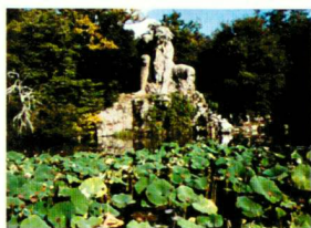
Le célèbre «Apennin» de Giambologna au parc de Pratolino, Florence.