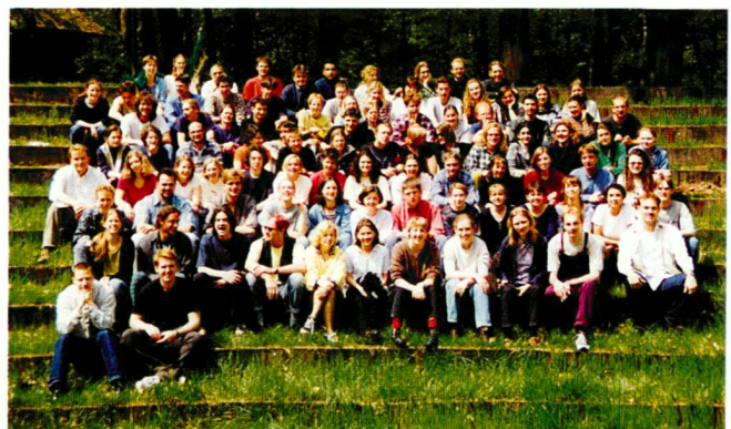
Rencontre de l'ELASA à Vierhouten