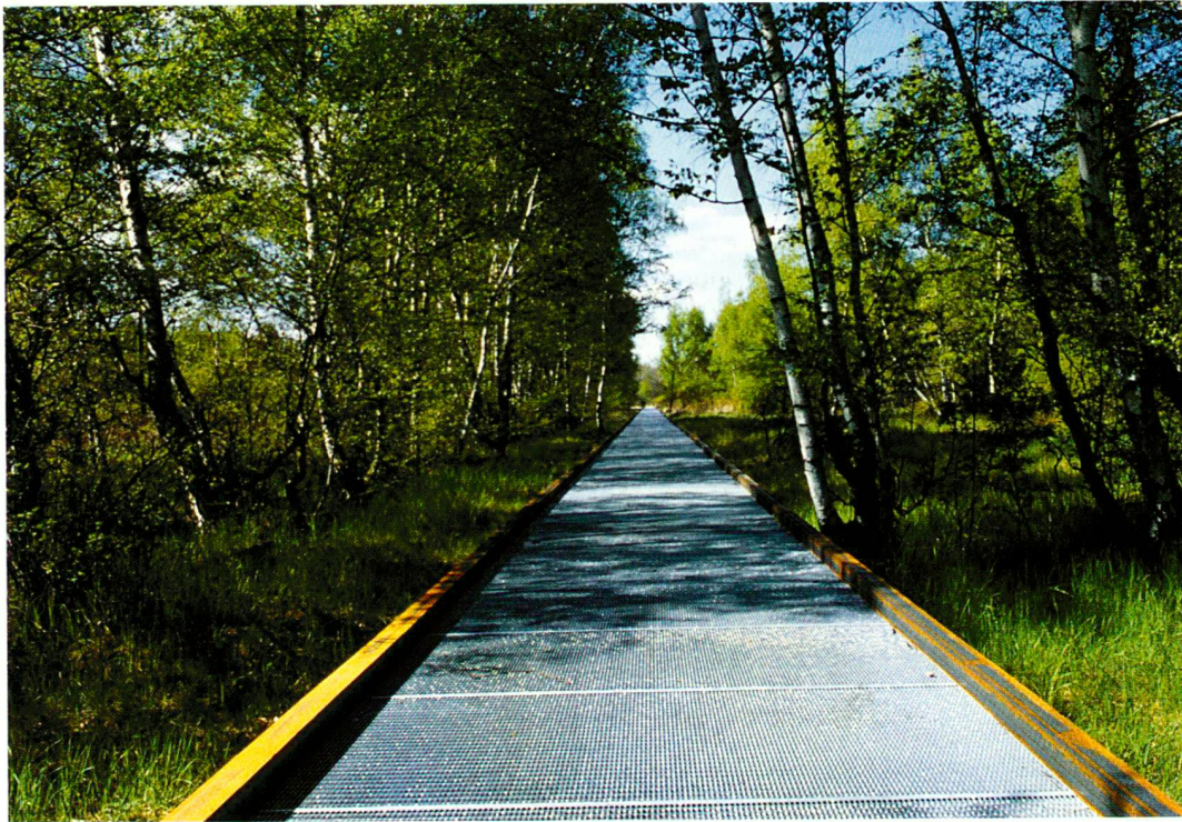
Steganlage durch das Naturschutzgebiet, Entwurf und Ausführung Künstlergruppe Odious

Passerelle dans la réserve, projet et construction: Künstlergruppe Odious.