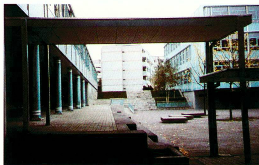
Place de jeux et verger