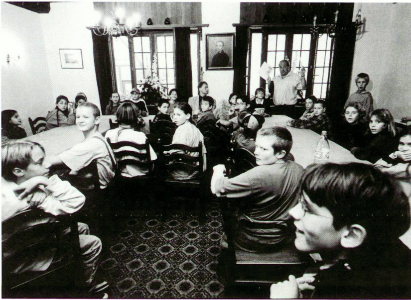
Kinderparlament mit Stadtpräsident Urs W. Studer

Die Kinder beschlossen als erstes, den Spielplatz «Alter Friedhof» oberhalb der Hofkirche zu sanieren und dafür 10 000 Franken einzusetzen. Das Kinderparlament wählte offiziell ein Bau-team mit 13 Kindern, welches beauftragt wurde,