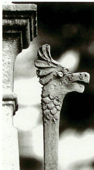
Detail eines Gartenzauns: geschmiedeter Vogelkopf

wurden die Informationen noch in den Computer eingegeben und die Dias eingelese. Und so liegt nun ein Werk vor, welches sich sehen lassen darf und dem Kanton offiziell übergeben werden konnte. In den acht Bezirken des Kantons mit den 103 Gemeinden wurden 1003 Objekte erfasst und mit Stichworten beschrieben, fotografiert und auf einer Karte eingetragen. Das Amt für Denkmalpflege wird das Original zur Archivierung erhalten. Dank der elektronischen Erfassung werden aber weitere Exemplare rasch und einfach zugänglich dem Raumplanungsamt, den Gemeinden und auch den Bundesstellen zur Verfügung gestellt werden können. Wir