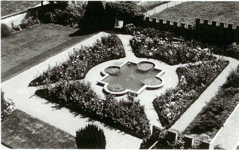
Schlosspark in der Seeburg Kreuzlingen

Vielversprechender sah es mit einem Beschäftigungsprogramm der «Stiftung Chance» aus. Das KIGA bewilligte sieben Stellen, und Anfang 1997 konnten bereits geeignete Bewerber gesucht und angestellt werden. Durch die Schaffung dieser Stellen konnte die Listenerfassung neu aufgeteilt und zugewiesen werden. Die Mitarbeiter brachten eine Grundvoraussetzung zur Erfassung historischer Gärten mit und wurden seriös eingeführt und regelmässig geschult. Die monatlichen Zusammenkünfte waren auch nötig, um die Kriterien für die Aufnahme der Liste aneinander anzugleichen. So waren jeweils ein bis drei Gruppen zu je zwei Personen tagtäglich unterwegs auf der Suche nach historischen Gärten und Anlagen. Die Landschaftsarchitekturbüros stellten den ersten Kontakt zu den Gemeinden her und waren zum Teil «Basis» und Arbeitsort bei schlechtem Wetter. Die Planbeschaffung, das Begehen, Fotografieren und Eintragen in der Liste, zusammen mit dem Erstellen einer Karte, lagen in den Händen der einzelnen Teams. Verschiedene Mitarbeiter fanden in der Zwischenzeit eine ihnen zuzugewandene neue Stelle und schieden wieder aus. Einige aber blieben uns während der vertraglichen sechs Monate treu, und so konnten wir auf Ende 1997 dem Abschluss der Feldaufnahmen entgegenzusehen. Über das Jahresende